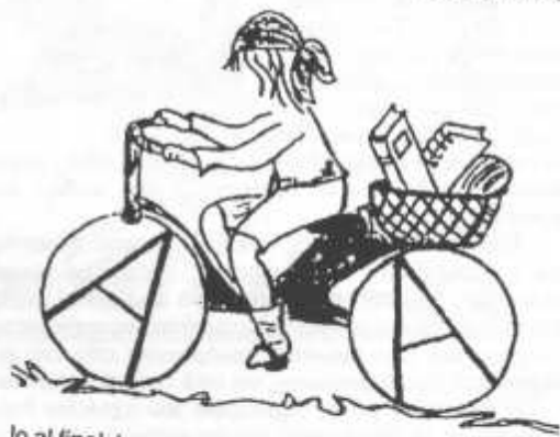
In al final

Η Παιδεία παρατάνω από σχολείο είναι μια κοινότητα από ανθρώπους που προσπαθούν εκτός από τη "δουλειά" τους, να μοιραστούν τις εμπειρίες και τους προβληματισμούς τους γι' αυτό που κάνουν, ερχόμενοι σε επαφή με άλλους απεξουσιαστές και αναρχικούς και οργανώνοντας εκδηλώσεις και προσπαθούν να ενθαρρύνουν ανάλογες προσπάθειες.