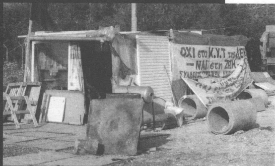
Το στέκι των κατοίκων στον υπο κατάληψη χώρο του ΚΥΤ

(Πηγή αριθμητικών στοιχείων εφ. «ΤΑ ΝΕΑ», 14-15/06/03)