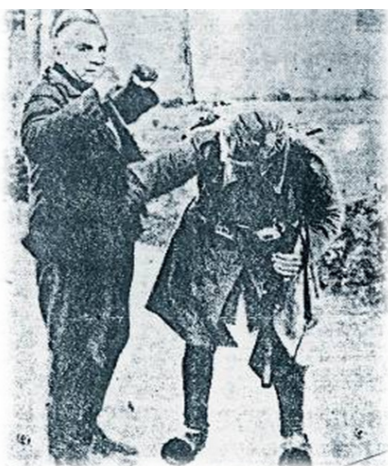
Σωματικός έλεγχος από ταγματасφαλίτη (γερμανοτοσολιά)

Όλα τα παραπάνω συνθέτουν μια εικόνα βίαιης καθημερινότητας, αλλά και διαρκούς και πολύμορφης αντίστασης που έδινε το στίγμα στη γειτονιά. Οι ίδιοι χώροι, οι ίδιοι δρόμοι, είναι ακόμη και σήμερα χαραγμένοι από το βάρος της ιστορίας τους, που τόσα έχει να μας μεταφέρει. Όμως η λήθη που επιμελώς καλλιεργήθηκε και επιβλήθηκε, ξεθώριασε τις μνήμες αυτής της εποχής. Τις μνήμες, που η ανάκληση και διαφύλαξή τους αποκτά, ειδικά σήμερα, μια πολύτιμη αξία.