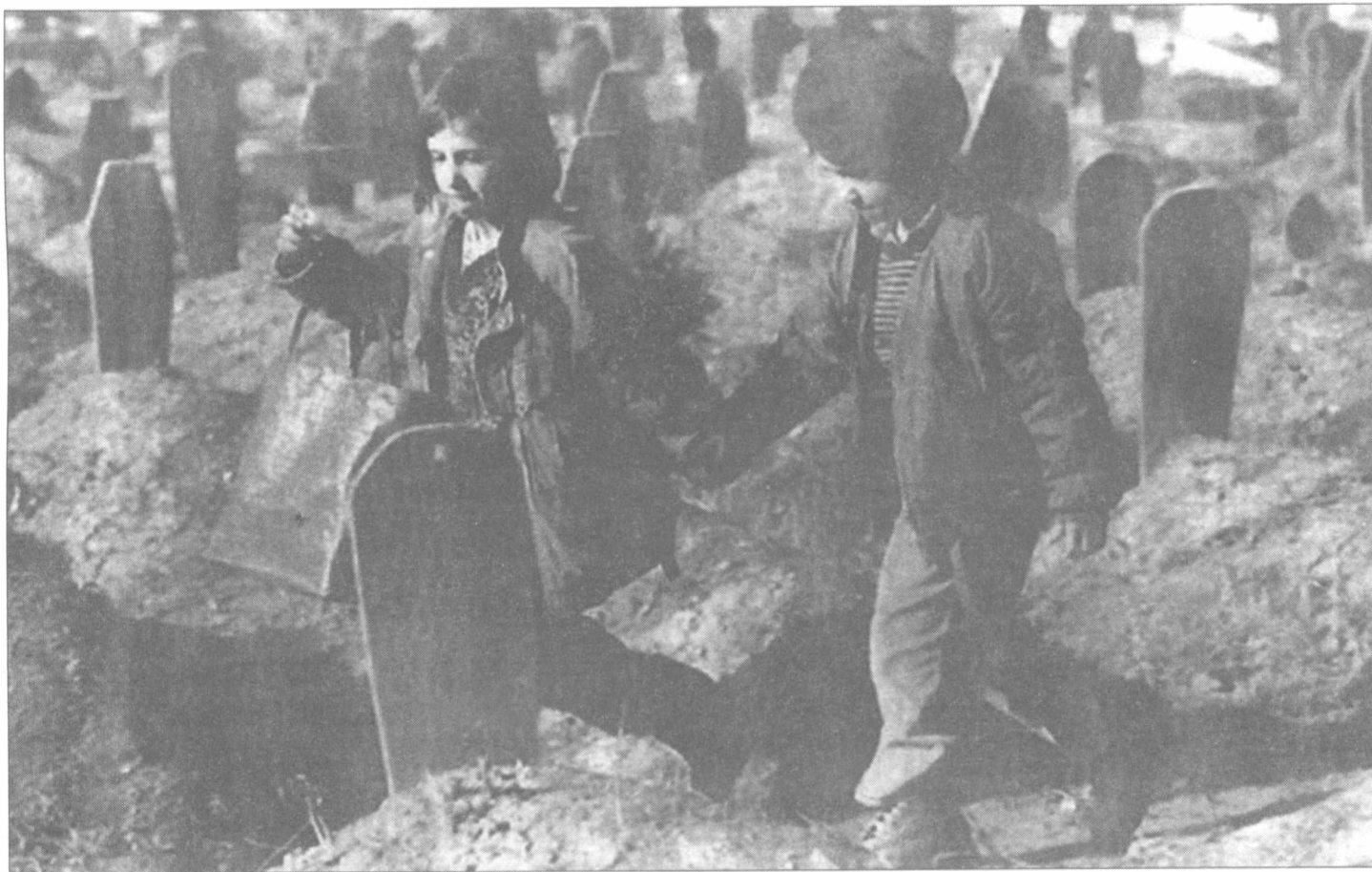
Τρέχαμε ανάμεσα στην βαρβαρότητα... Χέρι - Χέρι... Για να ζωγραφίσουμε το μέλλον

νά: η επιφάνεια των κινήσεων αυτών δεν έχει καμιά σχέση με την ουσία τους.