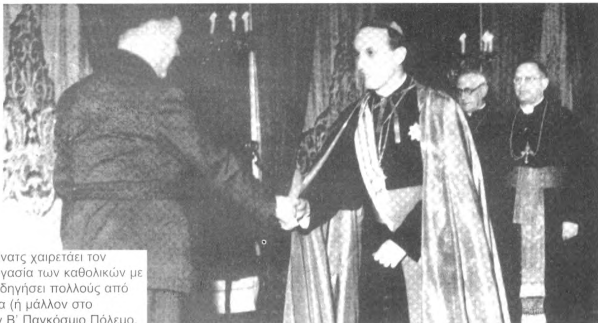
Ο καθολικός Στέπινατς χαιρετάει τον Πάβελιτς. Η συνεργασία των καθολικών με τους Ουστάζι θα οδηγήσει πολλούς από αυτούς στην εξορία (ή μάλλον στο Βατικανό) μετά τον Β' Παγκόσμιο Πόλεμο.