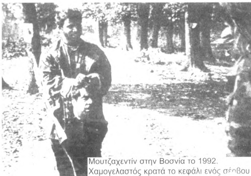
Μουτζαχεντίν στην Βοσνία το 1992. Χαμογελαστός κρατά το κεφάλι ενός σέηβου

Καινούργιες επιθέσεις του σέρβικου στρατού στο θύλακο της Σρεμπρένιτσα τον Μάιο του 1993, ενώ στις 2 Μαΐου 1993 ο ηγέτης των σέρβων της βοσνίας Ράντοβαν Κάραζιτς υπογράφει τη συμφωνία Βανς και Όουεν η οποία προβλέπει τον περιορισμό των σέρβων της βοσνίας στο 41% της