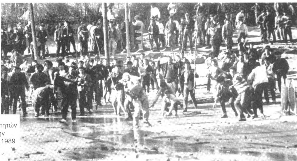
Συγκρούσεις αλβανόφωνων φοιτητών και αστυνομίας στην Πρίστινα στις 28,3,1989