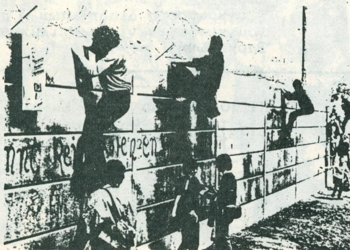
Auf der Mauer auf der Lauer

Με το σύνθημα: "Μιά ειρηνική διαδήλωση χρειάζεται κι ένα κίνημα μέσα στη αστυνομία" εισβάλλανε οι φύλακες της τάξης στα μέσα μαζικής ενημέρωσης της Ρηνανίας. Οι δημοσιογράφοι επισήμαναν αμέσως μιά καινούργια "επίσημη γραμμή" στην αστυνομία. Το Χάσελμπαχ αναγνωρίστηκε έτσι σαν "ευκαιρία για έρευνα πάνω στο θέμα της ειρηνικής συνύπαρξης διαδηλωτών-αστυνομικών".