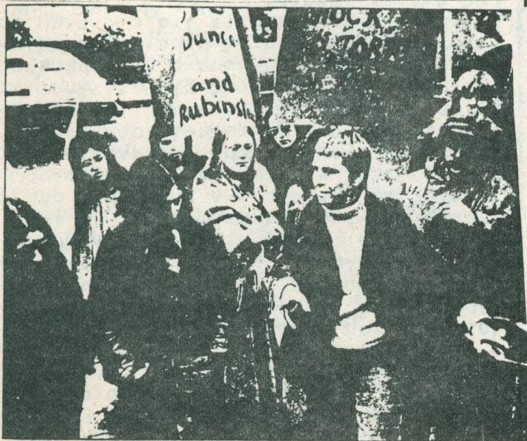
Διαδήλωση της NAPA (Network Against Psychiatric Assault) στην Καλιφόρνια έναντι ηλεκτροσόκ (από το Madness Network News, 1975).

Σαν εμπνευστές των απαράδεκτων μεθοδεύσεων σε βάρος του προσωπικού, το Διοικητικό Συμβούλιο του Σωματίου Εργαζομένων ΚΑΤΑΓΓΕΛΛΕΙ τους εργοδότες, κ' σαν εκτελεστές υπάλληλους-όργανα της εργοδοσίας".