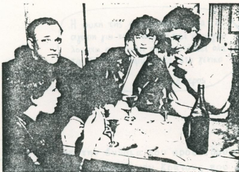
Σε κάθε στιγμή λοιπόν οι ομάδες και τα άτομα βρίσκονται μπροστά σε ανεπιθύμητα αποτελέσματα.

Αναμφίβολα σε μια έξαρση επαναστατικότητας η Beck's, εταιρεία κατασκευής και ομώνυμη μάρκα μπύρας, ανέλαβε τη χρηματοδότηση της έκθεσης στο ΙΣΑ. Δε θάπρεπε να μας ξαφνιάσει λοιπόν αν προσεχώς η εν λόγω εταιρεία χρησιμοποιήσει μια διαφήμιση σαν και αυτήν: