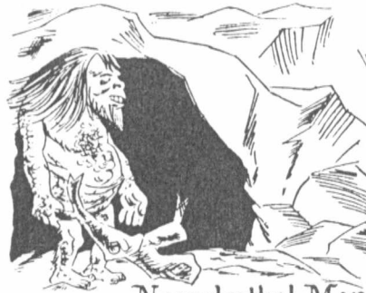
Neanderthal Man (Troglo-dyte)