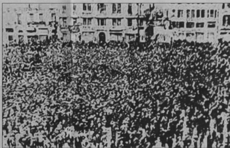
Από συγκέντρωση εργατικής πρωτομαγιάς στην Αθήνα