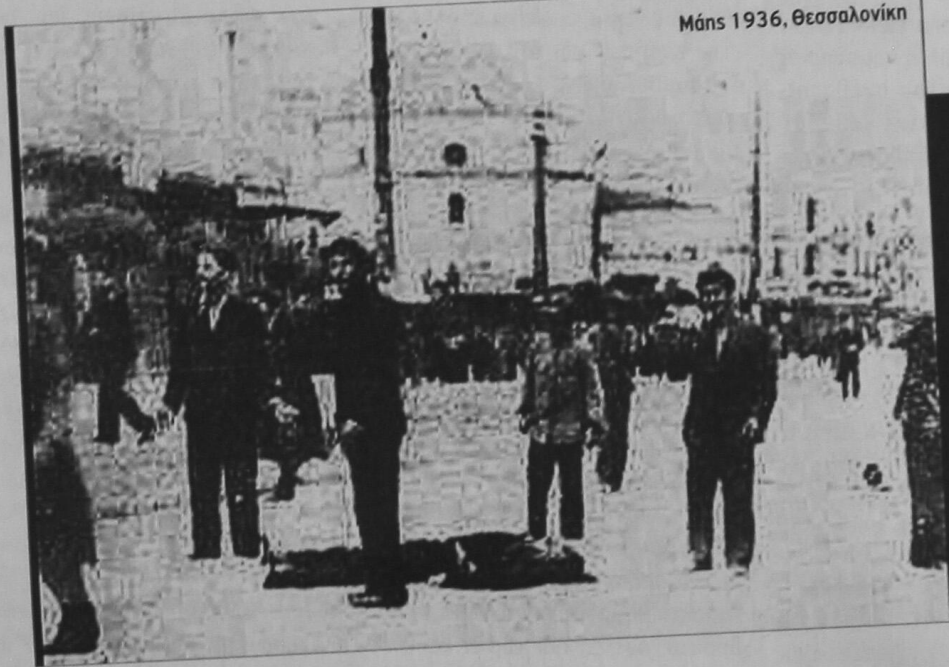
Μάης 1936, Θεσσαλονίκη

ΣΥΝΕΛΕΥΣΗ ΒΑΣΗΣ ΕΡΓΑΖΟΜΕΝΩΝ ΟΔΗΓΩΝ ΔΙΚΥΚΛΟΥ