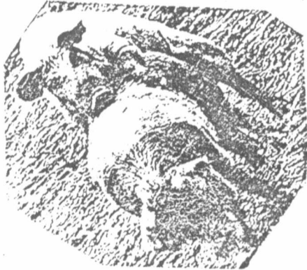
ΟΙ ΕΡΓΑΣΙΑΚΕΣ ΣΧΕΣΕΙΣ ΣΤΟΝ ΚΑΠΙΤΑΛΙΣΜΟ

- Σ' αυτήν την προοπτική που απαιτεί την συναίνεση, διαμέσω της ψευδαίσθησης της συμμετοχής (και όχι μόνο) εντάσσονται και οι αλλαγές που γίνονται στο κρατικό-καπιταλιστικό μπλόκ (ΕΣΣΔ, Πολωνία, Ουγγαρία κλπ) ανάγο-