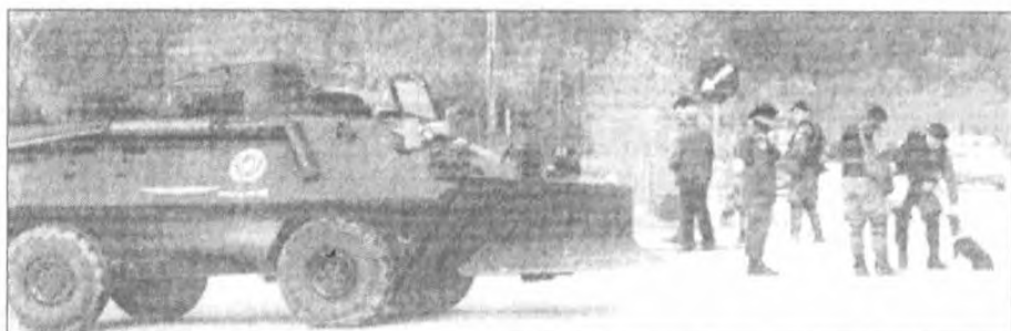
Άνδρες των ΜΑΤ έλεγχουν την εφοδιασμένη με εκτοκιστή μυστρών στην Ολυμπιάδα.

Εάν προκύψει ότι οι άτομα αυτά είναι υπεύθυνοι για την κατάσταση αυτή, η Αστυνομία ανακοινώνει ότι, κατά τη διάρκεια της έρευνας, οι αστυνομικοί έχουν συλλέξει πολλά έγγραφα, τα οποία είναι σε κατάσταση διαφύλαξης και είναι σε θέση να τα παραδώσουν στην Εισαγγελία.