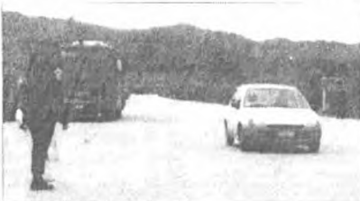
Εστιασμένο ενέδρα. Οπως ανακοινώθηκε η Αστυνομία 20 άτομα προέρχονται από την Ολυμπιάδα της Χαλκιδικής.

Εάν προκύψει ότι οι άτομα αυτά είναι υπεύθυνοι για τις αντεγκινήσεις που τα τελευταία