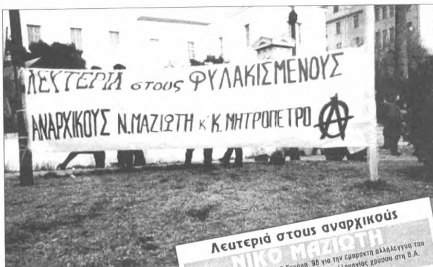
Από τη συγκέντρωση αλληλεγγύης στο πνευματικό κέντρο της Αθήνας στις 25 Φλεβάρη '99