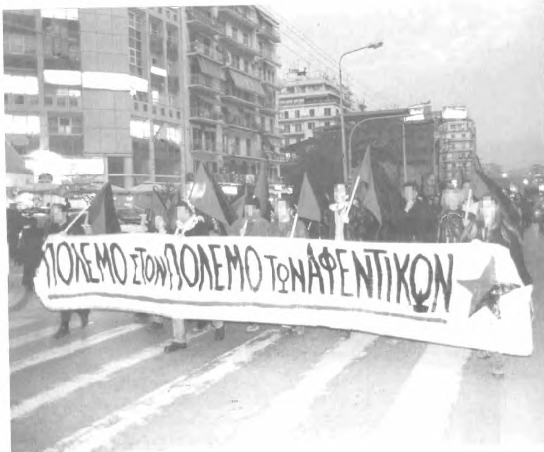
Από πορεία που οργανώθηκε στη Θεσ/νίκη από τις πολιτικές νεολαίες όλων των κομμάτων, με την έναρξη των βομβαρδισμών στη Γιουγκοσλαβία