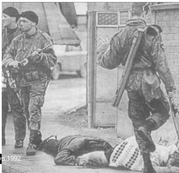
...και οι άντρες του. Εκκαθαρίσεις στη Μπιλεγίνα, 1992.