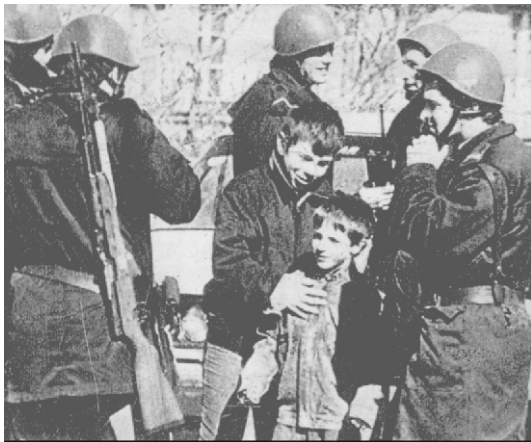
1989, κόσσοβο. Στρατιωτικός νόμος

Στην ηγεσία των αλβανών του κοσόβου βρίσκεται ο μετριοπαθής Ιμπραήμ Ρουγκόβα. Σε αυτόν και στην πολιτική που ακολούθησε οφείλεται, μετά την πρώτη φάση της κατάργησης της αυτονομίας του κοσόβου, το ότι το κόσσοβο δεν πήρε μέρος στον σερβοκρατοβοσνιακό πόλεμο, αφού ήταν θιασώτης μιας παθητικής-άοπλης αντίστασης. Βέβαια εδώ πρέπει να σημειώσουμε ότι στη διαμόρφωση μιας τέτοιας πολιτικής βοήθησε αρκετά και το γεγονός ότι τότε ακόμη δεν τους είχε "υιοθετήσει" κανένας. Μετά την υπογραφή όμως της συμφωνίας του Dayton, το καθεστώς Μιλόσεβιτς αρχίζει να κάνει και εδώ ό,τι και στη Βοσνία, να εφαρμόζει δηλαδή την πολιτική των εθνικών εκκαθαρίσεων. Τα καψίματα των χωριών και οι πρώτες δολοφονίες των αμάχων δημιουργούν και τα πρώτα караβάνια των προσφύγων. Δημιουργούν όμως επίσης και μια ριζοσπαστική αντιπολίτευση στον Ρουγκόβα, η οποία μπορεί να είναι μειοψηφική, αλλά όσο εντείνεται η πολιτική των εθνικών εκκαθαρίσεων τόσο πιο πολύ αποκτά κοινωνικά ερείσματα στο κόσσοβο και τόσο πιο πολύ ριζοσπαστικοποιείται. Όχι με την έννοια ότι προβάλλει προτάγματα για την κοινωνική απελευθέρωση, αλλά με την έννοια ότι κατευθύνεται προς τον ένοπλο αγώνα. Έτσι στα 1996 εμφανίζεται ο UCK τοποθετώντας βόμβες εναντίον σερβικών στόχων. Ο Ρουγκόβα, αρχικά, τον καταγγέλει ως όργανο του Μιλόσεβιτς. Όμως η εντεινόμενη καταπίεση οδηγεί πολλούς