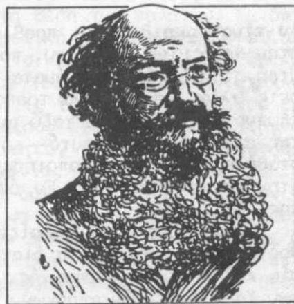
Ο Πιότρ Αλεξέγεβιτς Κροπότκιν

Πριν από λίγα χρόνια, ο αναρχικός εκδοτικός οίκος FREEDOM PRESS εξέδωσε μια συλλογή άρθρων του Π.Κροπότκιν, ανέκδοτων μέχρι σήμερα, σε επιμέλεια των Ν. Ουώλτερ και Χ. Μπέκερ, και με τον γενικό τίτλο ΑΥΤΕΝΕΡΓΕΙΣΤΕ (ACT FOR YOURSELVES). Δεδομένου του μικρού τους όγκου, σκέφτηκα να τα δημοσιεύσω—σχολιάζοντας κάποια σημεία τους αλλά και λέγοντας κάποια πράγματα απ' αφορμή αυτών.