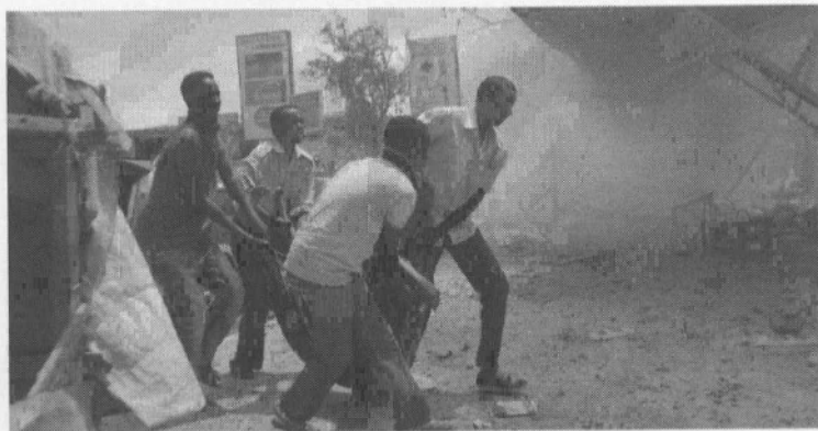
27/2/2014 : ΣΟΜΑΛΙΑ. Σκηνή της καθημερινής ζωής σε στρατόπεδο προσφύγων, έξω από το Μογκαντίσου.

Ο πολιτισμένος κόσμος (φυσικά και η Ελλάδα) θυμάται τους Σομαλούς μόνο όταν - ΩΣ ΠΕΙΡΑΤΕΣ - τους αρπάζουν κάποιο πλεούμενο ή όταν - ΩΣ ΜΕΤΑΝΑΣΤΕΣ - αποτελούν αντικείμενο εκμετάλλευσης της ρατσικής ή της αντιρ-ρατσικής πολιτικής των κυβερνήσεων (ή των «μη-κυβερνητικών» οργανώσε'ων) τους.