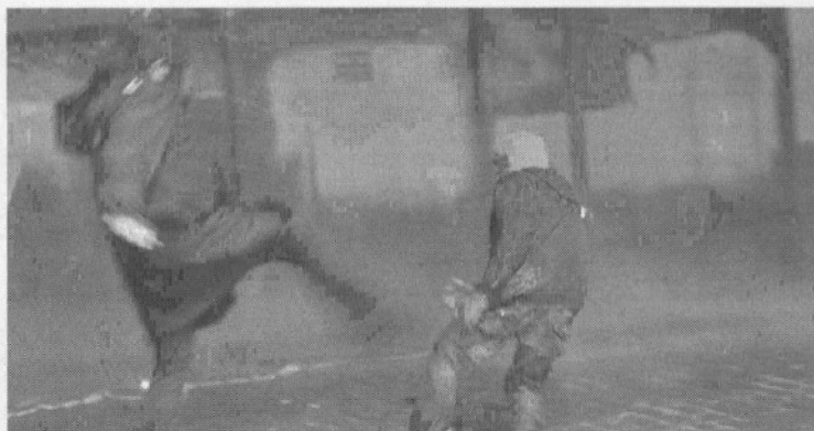
12/3/2014 : ΤΟΥΡΚΙΑ.