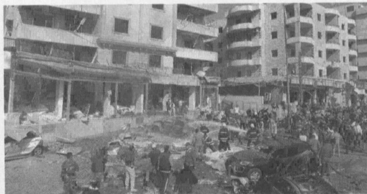
19/2/2014 : ΛΙΒΑΝΟΣ. Μια ακόμη έκρηξη στο κέντρο της Βηρυτού.