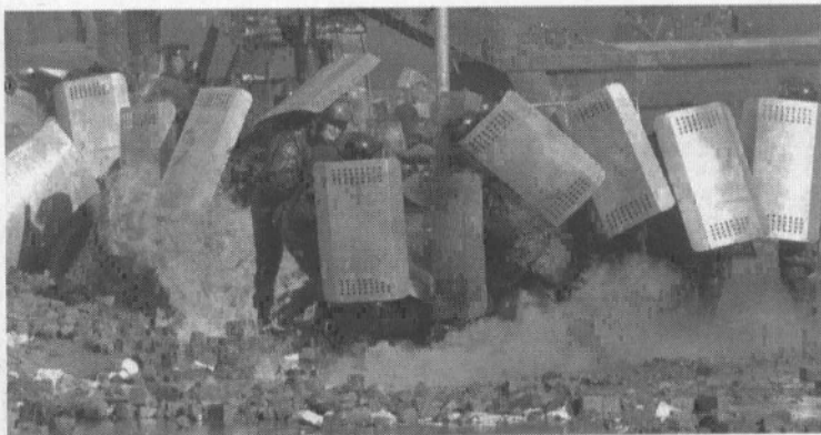
18/2/2014 : ΟΥΚΡΑΝΙΑ.