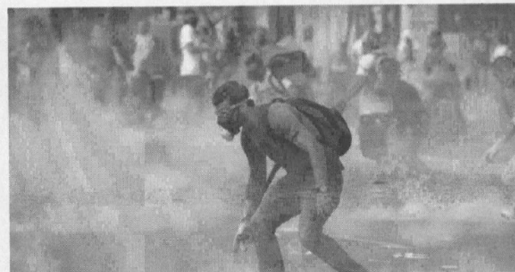
19/2/2014 : ΒΕΝΕΖΟΥΕΛΑ. Μαχητική διαδήλωση κατά του προέδρου Maduro.