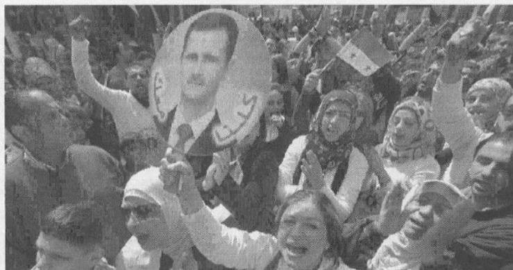
16/3/2014 : ΣΥΡΙΑ. Μια ακόμη διαδήλωση υπέρ του Άσαντ. Απ' αυτές που στην Ελλάδα δεν βλέπουν και δεν ακούν ούτε οι προοδευτικοί - αριστεροί ΣΥΡΙΖΑίοι...