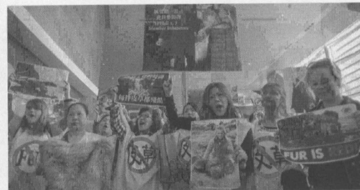
25/2/2014 : ΧΟΝΓΚ ΚΟΝΓΚ. Διαδήλωση ενάντια στην αρπαγή της γούνας των ζώων... για χάρη των αμάλλιαγων, αλλά πολιτισμένων, ζώων.