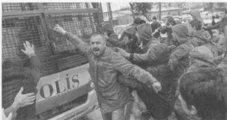
11/3/2014 : ΤΟΥΡΚΙΑ.