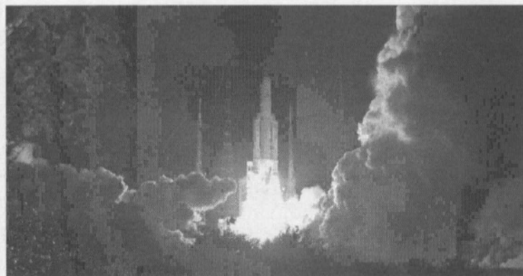
22/3/2014 : ΓΑΛΛΙΚΗ ΓΟΥΪΑΝΑ. Τί σου είναι λοιπόν αυτοί οι Γάλλοι... Αντι-αποικιοκράτες μέχρι το μεδούλι των κοκκάλων τους. Σαν να μην τούς έφτανε η ειρηνευτική τους επιχείρηση στο