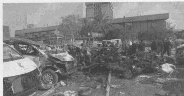
7/3/2014 : ΙΡΑΚ. Σκηνή έκρηξης στην ανυπότακτη Βαγδάτη.

Ο πολιτισμένος κόσμος (φυσικά και η Ελλάδα) θυμάται τους Σομαλούς μόνο όταν - ΩΣ ΠΕΙΡΑΤΕΣ - τους αρπάζουν κάποιο πλεούμενο ή όταν - ΩΣ ΜΕΤΑΝΑΣΤΕΣ - αποτελούν αντικείμενο εκμετάλλευσης της ρατσικής ή της αντιρ-ρατσικής πολιτικής των κυβερνήσεων (ή των «μη-κυβερνητικών» οργανώσε'ων) τους.