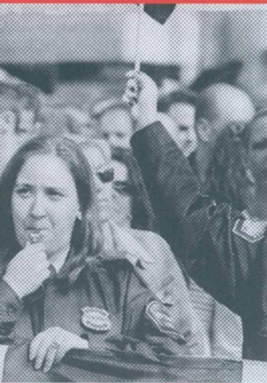
σεκκιουριτού που διαδηλώνει το δικαίωμά της να έχει εκπαίδευση τροχονόμου

Έτσι κι αλλιώς "τα αγαθά κόποις κτώνται".