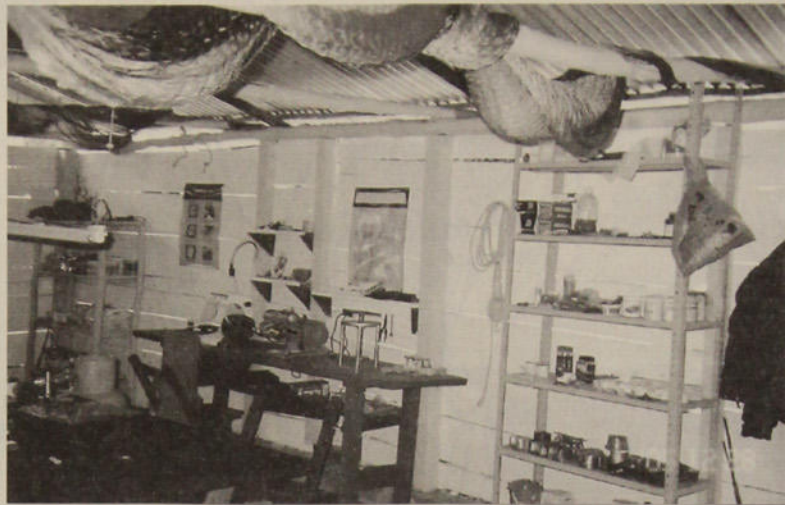
το ορθοδοντικό εργαστήριο

8.- Por último nos gustaria que nos subrayaraís vuestras necesidades y vuestras ideas y pensamientos políticos sobre el tipo de acciones solidarias con vosotros que podemos llevar a cabo.