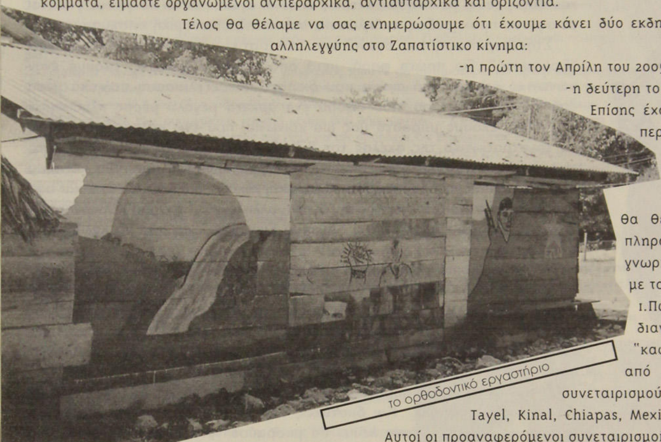
το ορθοδοντικό εργαστήριο