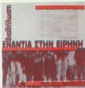
Η πρώτη διαδήλωση της συνέλευσης ενάντια στην ειρήνη, 5 Ιουνίου 2003, κολλήθηκε σε 8.000 αντίτυπα στο κέντρο και στις γειτονίες της Αθήνας