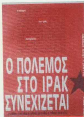
η πρώτη αφίσα της συνέλευσης, κολλήθηκε σε 4.000 αντίτυπα από τον δεκέμβριο μέχρι και τον Ιούνιο, παράλληλα με τις αφίσες που ακολουθούν