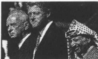
Ράμπιν, Κλίντον και Αραφάτ, σε «αναμνηστική» φωτογραφία, μετά τις υπογραφές της «ειρήνης». Ο ένας είναι σήμερα νεκρός ο άλλος πρώην, και ο τρίτος «ξεγραμμένος» από πολλές πλευρές...

Πριν δούμε ορισμένες (όχι και τόσο) «λεπτομέρειες» εκείνης της διακήρυξης, που έμελλε να κάνει περισσότερο «αθέατη» διεθνώς και πιο τυρρανική την κυριαρχία του ισραηλινού κράτους πάνω στους παλαιστίνιους, θα πρέπει να θυμησούμε το «ιστορικό περιβάλλον» της.