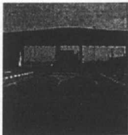
Το πέρασμα του Erez, έρημο μετά τον αποκλεισμό της λωρίδας της Γάζας.

Ο ισραηλινός καπιταλισμός εντός των ορίων του ισραηλινού κράτους στηρίζεται σε 4 βασικά τομείς: αγροτική παραγωγή, κατασκευές, τουρισμός και στη δεκαετία του '90 στους κλάδους της υψηλής τεχνολογίας, που σχετίζονται και με την βιομηχανία όπλων. Το παλαιστινιακό προλεταριάτο προοριζόταν και προορίζεται κυρίως για τους τρεις πρώτους και μ' αυτή την έννοια η «διαχείρισή» του αποτελεί κεντρικό ζήτημα για το κεφάλαιο μέσα στο κράτος του ισραήλ. Στην γεωγραφικά προσδιορισμένη Παλαιστίνη, (τα εδάφη του τωρινού ισραηλινού κράτους μαζί με την Δυτική Όχθη και τη λωρίδα της Γάζας) ζούν σήμερα 5,1 εκατομμύρια εβραίοι και 4,1 εκατομμύρια άραβες - ενώ οι παλαιστίνιοι πρόσφυγες που ζουν σε στρατόπεδα στη συρία, στο λίβανο και στην ιορ-