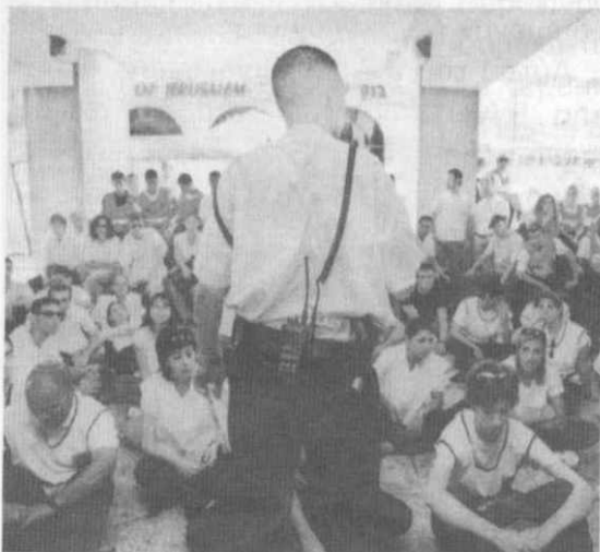
ισραηλινός αστυνομικός διδάσκει σε νέους την αντιμετώπιση των χαμικάζι

Επίσης, αρνήσεις στρατιωτών να υπηρετήσουν στα κατεχόμενα από το '67 εδάφη (το 1972 εμφανίζονται οι πρώτοι επιλεκτικοί αρνητές, ο Yossi Kotten και ο Yitzak Laor, ενώ ως τα τέλη του 2002 περίπου 1200 ισραηλινοί έχουν δηλώσει πρόθεση άρνησης, 500 έχουν ήδη αρνηθεί, ενώ πάνω από 200 έχουν εκτίσει ποινές φυλάκισης για την απόφασή τους να μην υπηρετήσουν στα παλαιστινιακά εδάφη), ολικές αρνήσεις στράτευσης τα τελευταία χρόνια, άνοιγμα κλειστών εισόδων του τείχους, κοινά κάμπινγκ Ισραηλινών και Παλαιστινίων κ.α.