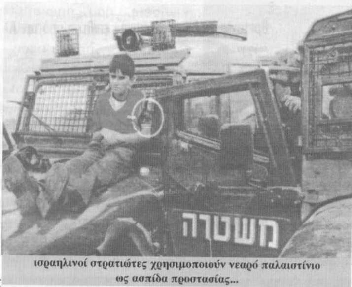
ισραηλινοί στρατιώτες χρησιμοποιούν νεαρό παλαιστίνιο ως ασπίδα προστασίας...

στιγματίστηκαν ως προδότες και υπέστησαν εξευτελισμούς. Η ένταση των αντιδράσεων αυτών έχει μειωθεί τον τελευταίο καιρό κι αυτό οφείλεται, τόσο στη διάρκεια και στην άνοδο τέτοιων κινήσεων αντίστασης, όσο και στο αδιέξοδο, στο οποίο έχουν οδηγήσει οι πολιτικές του ισραηλινού κράτους. Έτσι, παρά την έντονη προπαγάνδα των ισραηλινών ΜΜΕ, που χρησιμοποιώντας τις επιθέσεις αυτοκτονίας προσπαθούν να πείσουν για την ορθότητα των κρατικών σχεδιασμών και επιλογών, οι οποίες σπέρνουν το θάνατο, παρατηρούμε μια σταδιακή αλλαγή στις αντιλήψεις της ισραηλινής κοινωνίας.