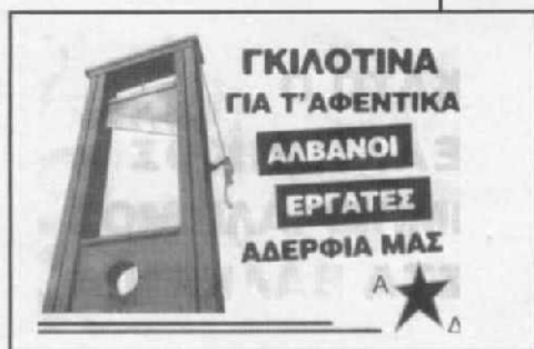
τρικάκι που πετάχτηκε σε αθήνα, θεσσαλονίκη και άλλες πόλεις

Στις αρχές της δεκαετίας του '90, κατά τη διάρκεια του πολέμου στην Κροατία και τη Βοσνία-Ερζεγοβίνη, όπως και αργότερα με τον πόλεμο στο Κόσσοβο, οι στυλοβάτες της ελληνοσερβικής φιλίας (ΜΜΕ, κόμματα, think tank, ΜΚΟ κ.α.) πλαστογραφούσαν συστηματικά την κοινωνική ιστορία της πρώην Γιουγκοσλαβίας. Χαρακτηριστικό παράδειγμα ήταν από τη μία η επιμονή των ελληνικών μήντια σχετικά με το φασιστικό παρελθόν των κροατών και