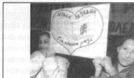
η ελληνική σημαία δίπλα στο εθνικιστικό σήμα των σέρβων. Ο σταυρός με τα 4C σημαίνει: "μόνο η ενότητα θα σώσει τους σέρβους".

'90, υιοθέτησε την παράδοση των Τσέτνικ και οργάνωσε ομώνυμες παραστρατιωτικές ομάδες, που έδρασαν στη Βοσνία στο διάστημα 1992-1995. Μαζί με άλλες παραστρατιωτικές συμμορίες έκαναν τη βρώμικη δουλειά των εθνικών εκκαθαρίσεων. Το κόμμα αυτό έχει στενές επαφές με νεοφασίστες στην ανατολική και δυτική Ευρώπη. Τον Οκτώβριο του 1998 ο Λεπέν έστειλε στο Βελιγράδι έναν απεσταλμένο του, για να δηλώσει δημόσια την υποστήριξή του στον Σέσελι. Δεν ήταν ο μόνος. Η ελληνοσερβική φιλία εκφράστηκε σε καλλιτεχνικό, πολιτικό και κοινωνικό επίπεδο, με τη διοργάνωση διαδηλώσεων και συναυλιών αλληλεγγύης, με τη φιλοξενία στην Ελλάδα μόνο σερβοβόσνιων παιδιών και με την αποστολή ανθρωπιστικής βοήθειας.