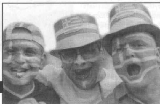
οπαδός της εθνικής και στη δουλειά μαλάκας

Παρόλα αυτά, τι κι αν έχουμε όλη μέρα πάνω από το κεφάλι μας το αφεντικό, τον προϊστάμενο, τον μάντζερ, εμείς, θα 'λεγαν οι πρώτοι, δεν είμαστε σαν τους χειρωνάκτες (ή τους μετανάστες). Είμαστε κάτι άλλο, είμαστε κάτι "πο" πάνω π.χ. από τους κούριερ, παρόλο που πολλοί από αυτούς μπορούν εκεί έξω, στους δρόμους, να λουφάρουν και να κλέβουν πολλές ώρες από τα αφεντικά τους. Κάτι που εμείς δεν μπορούμε να κάνουμε υπό το άγρυπνο μάτι της εργοδοσίας. Αν σκεφτείς επίσης, ότι στην παρέα μας αυτο-συστηνόμαστε ως "υπάλληλοι", τότε είμαστε κάτι άλλο, δεν είμαστε "εργάτες", αφού αυτός όρος κουβαλάει στην πλάτη του μια βαριά ιστορία. Το σημαντικότερο κίνητρο είναι ο ελεύθερος χρόνος μας, οι "μικρές απολαύσεις" της ζωής, η απόκτηση και της πιο ελάχιστης ιδιοκτησίας. Ακόμη και τα ρούχα, μας κάνουν να νιώθουμε αλλιώς. Ναι, είμαστε