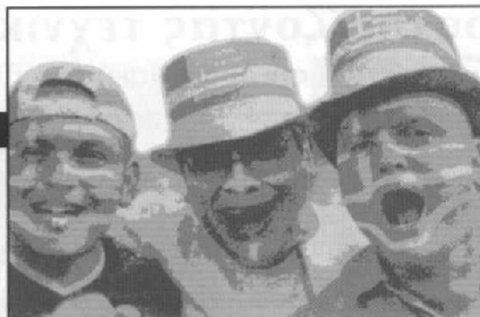
ανήκουμε στο οικονομικό θαύμα του '90, που στηρίχθηκε στη φτηνή εργασία και τη βία κατά των μεταναστών

διαφορετικοί κάθε φορά που βαριόμαστε το "παλιό" και αγοράζουμε κάτι καινούριο.