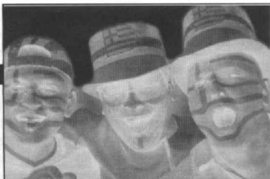
ανήκουμε στον ελληνικό στρατό που προστατεύει τη λεηλασία των επενδυτών