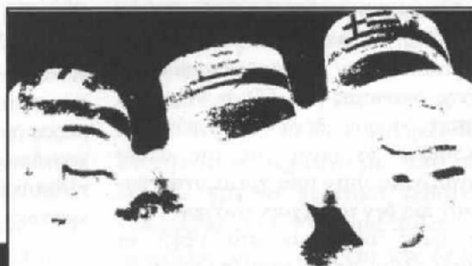
ανήκουμε στους επενδυτές που λεηλατούν τα Βαλκάνια