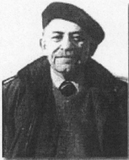
Murray Bookchin 14 Γενάρη 1921 - 30 Ιούλη 2006

Θλίψη αυτών που μένουν για την απώλεια. Τιμή για τον ίδιο η συνέπεια στις αρχές του Πάντα επίκαιρο το έργο του, και τώρα και στο μέλλον.