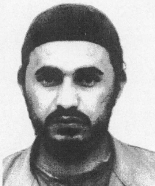
Αμπού Μουσάμπ Αζ-Ζαρκαουί 20/10/1966 - 7/6/2006

Θα ξεχαστεί (ίσως σύντομα)/ Τώρα, όμως, πονάει. Ίσως γιατί μαζί του φεύγει κι ένα κομμάτι της δικής μας ζωής.