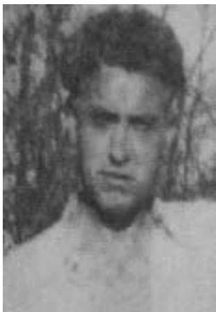
34. Ο Φαμπιάν Νούεθ συμμετείχε σε μια ομάδα αναρχικών ανταρτών προερχόμενη από τη Γαλλία, η οποία προσπάθησε ανεπιτυχώς να εγκατασταθεί στη νότια Αραγόνα. Δολοφονήθηκε κατά τη διάρκεια μάχης στις αρχές του 1949.