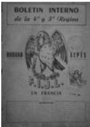
53. Εσωτερικό έντυπο της εξόριστης FIJL του Κλερμόν Φεράν, 1958.