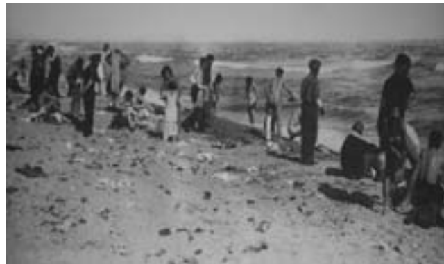
11. Φωτογραφία από το γαλλικό στρατόπεδο συγκέντρωσης προσφύγων στο Αρζελέ, στις 27/2/1939. Οι ανύπαρκτες υποδομές ανάγκασαν πάνω από 100.000 πρόσφυγες, που ζούσαν κλεισμένοι σε ελάχιστα στρέμματα παραλίας, να χρησιμοποιούν για την προσωπική τους υγιεινή τη θάλασσα.