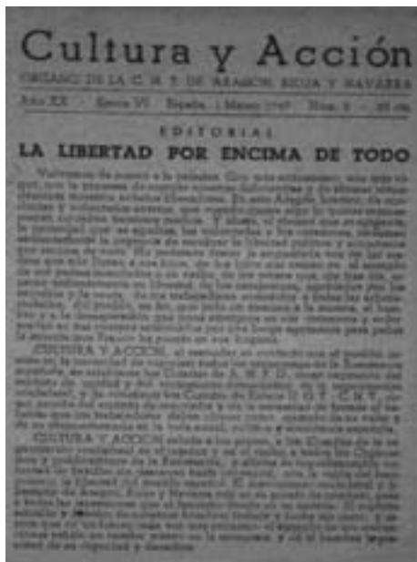
21. Η εφημερίδα Cultura y Acción, έντυπο της περιφερειακής επιτροπής Αραγόνας, Ναβάρρα και Ριόχα. Παράνομο φύλλο, Μάρτης του 1947.