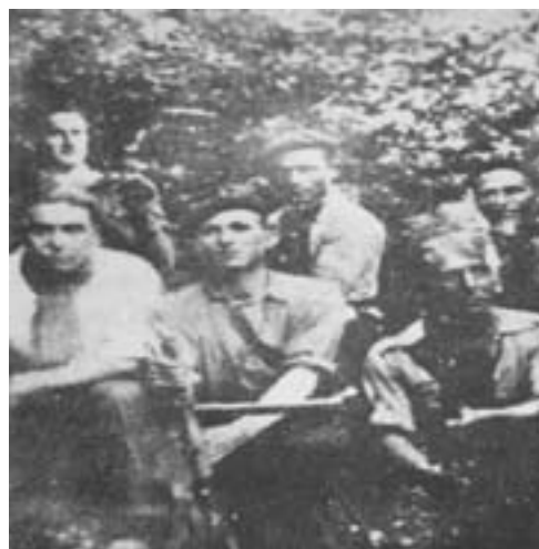
33. Η ανάρτικη ομάδα των Αρίας που έδρασε στη βορειοανατολική Λεόν. Στελεχώθηκε από ανθρακωρύχους της CNT. Μετά τη φυλάκιση ενός μέλους και την εκτέλεση δια στραγγαλισμού άλλων δύο το 1947, οι υπόλοιποι διέφυγαν στη Γαλλία.