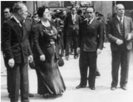
6. Στιγμές ντροπής. Στο κέντρο της φωτογραφίας οι αναρχικοί υπουργοί Φεδερίκα Μοντσένυ και Χουάν Γκαρθία Ολιβέρ. Στα αριστερά τους ο Αρτέμι Αϊγουαδέ, πρωταγωνιστής της αντίδρασης κατά τα γεγονότα του Μάη του 1937 στη Βαρκελώνη.