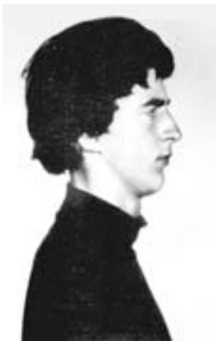
65. Ο Στιούαρτ Κρίστι (1946), γνωστός σκωτσέζος αναρχικός, στη φωτογραφία της σύλληψής του, το 1964, στη Μαδρίτη. Μετά την αποφυλάκισή του το 1967, ο Κρίστι συμμετείχε στην ίδρυση του Αναρχικού Μαύρου Σταυρού και στην Οργισμένη Ταξιαρχία.