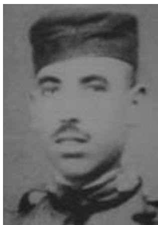
29. Ο Μανουέλ Καστίγιο «Σαλσιπουέδες», αναρχικός καπετάνιος των ανταρτών της Χαέν κατά την περίοδο των φυγάδων. Δολοφονήθηκε σε συμπλοκή στις 10/2/1943.