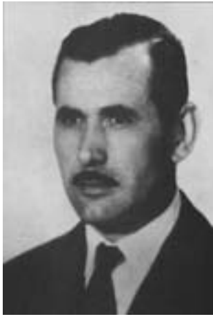
51. Ο Φρανσίσκο Σαμπατέ «Κίκο» (1915-1960), ο γνωστότερος αναρχικός αντάρτης της αντιφρανκικής αντίστασης, σε φωτογραφία του 1946. Δολοφονήθηκε σε συμπλοκή στο Σαν Σερόνι στις 5/1/1960.