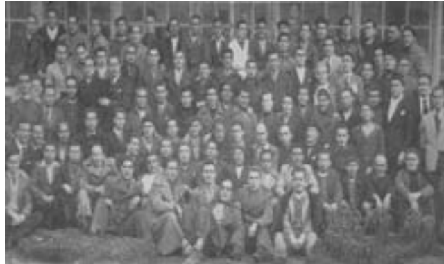
9. Φυλακισμένοι ελευθεριακοί στη φυλακή του Μπούργος, 1942.