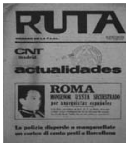
57. Η εφημερίδα Ρούτα της FIJL ανακοινώνει την απαγωγή του Ουσία. Βρυξέλλες 1966.