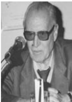
16. Ο Αμπραάμ Γκιγιέν (1913-1993), μέλος των πρώτων παράνομων εθνικών επιτροπών της CNT. Μετανάστευσε στη Λατινική Αμερική, όπου ανέπτυξε τη θεωρία του αντάρτικου πόλης και συμμετείχε στα αντάρτικα των Ουτουρούνκος και των Τουπαμάρος.