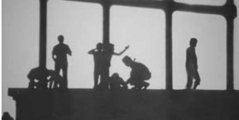
74. Εξέγερση στη φυλακή του Καραμπαντσέλ στη Μαδρίτη, το 1977.