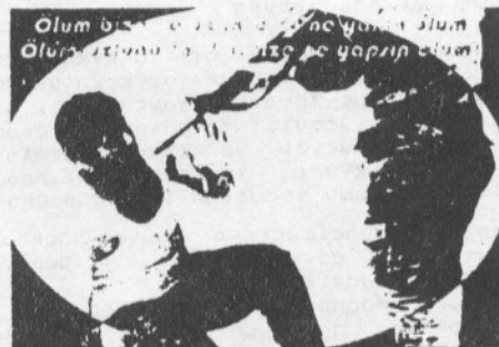
Αφίσσες του Ισλαμικού Κόμματος