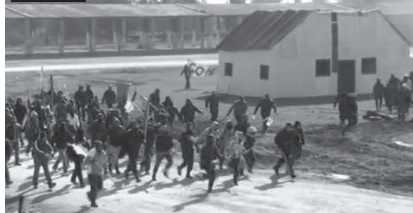
Στρατιωτική Άσκηση ΚΑΛΙΜΑΧΟΣ