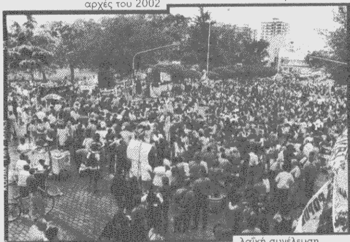
λαϊκή συνέλευση σε κάποια γειτονιά του Buenos Aires