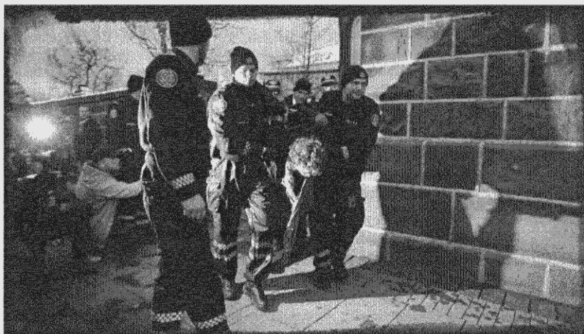
Η σύλληψη ενός από τους “9 του Ρέικιαβικ” στις 8 Δεκεμβρίου του 2008

Πρόσφατα η βουλή ψήφισε να ασκηθεί ποινική δίωξη στον Geir H. Haarde, πρω-