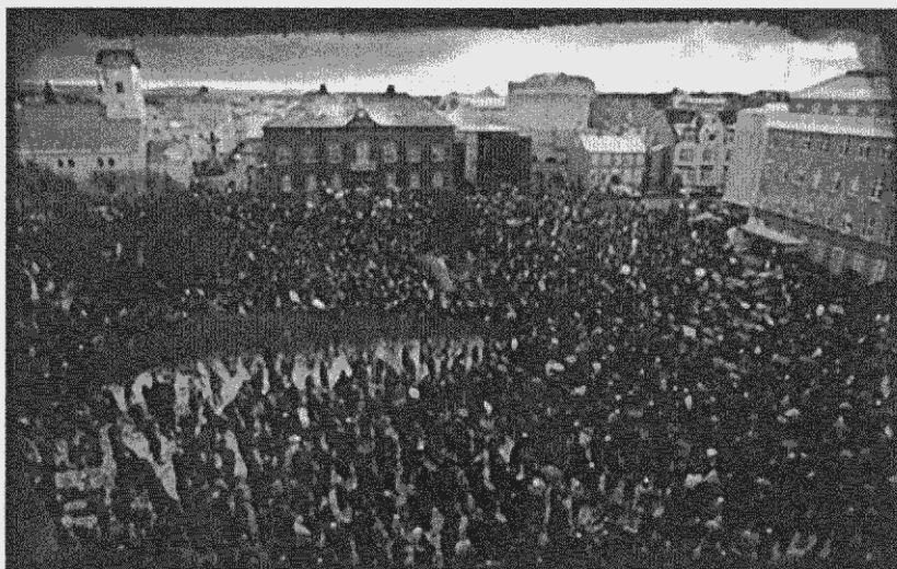
Από τον Οκτώβριο του 2008, χιλιάδες κόσμου διαδηλώνουν στους δρόμους του Ρέικιαβικ ενάντια στην κρίση

ναγματικό δικαίωμα των πολιτών να παρακολουθούν τη συνεδρία της βουλής από τα έδρανα των επισκεπτών. Οι αστυνομικοί απείλησαν τους διαδηλωτές με σπρέι πιπεριού και τους προπηλάκισαν προσπαθώντας να τους εμποδίσουν να ανέβουν τις σκάλες για το θεωρείο των επισκεπτών. Ωστόσο, δυο διαδηλωτές κατόρθωσαν να φτάσουν στο θεωρείο και να φωνάξουν την ακίνδυνη αλλά αληθή δήλωση “ξεκουμπιστείτε από δω μέσα, αυτό το κτίριο δεν υπηρετεί πια το σκοπό του”. Για να μην μακρηγορούμε, οι τριάντα διαδηλωτές κρατήθηκαν όμηροι στο κλιμακοστάσιο της βουλής, ώσπου οι αστυνομία συνέλαβε εκείνους που ήθελε. Στο πλαίσιο αυτής της διαδικασίας υπήρξαν μικρές αψιμαχίες μεταξύ μπάτσων και διαδηλωτών. Έξω από το κοινοβούλιο –όπου γίνονταν χαμός από media, ανθρώπους, κάμερες– μερικοί ακόμα διαδηλωτές, που μόλις είχαν βγει από το κτίριο, συνελήφθησαν. Με όλα αυτά η συνεδρία της βουλής καθυστέρησε για περισσότερο από δύο ώρες. Ένα χρόνο μετά σε εννέα από τους τριάντα διαδηλωτές αποδόθηκαν κατηγορίες.