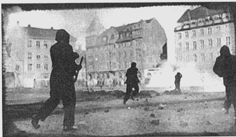
Από τις αντινατοϊκές διαδηλώσεις του 1949

Η δίκη των "9 του Ρέικιαβικ" είναι ιστορικής σημασίας. Το άρθρο 100 του ποινικού κώδικα έχει χρησιμοποιηθεί μόνο μια φορά στο παρελθόν, μισό αιώνα πριν, όταν αρκετοί άνθρωποι καταδικάστηκαν σε φυλάκιση και στερήθηκαν τα πολιτικά τους δικαιώματα, συμπεριλαμβανομένου του δικαιώματος ψήφου, επειδή συμμετείχαν στις μαζικές διαδηλώσεις της 30ης Μαρτίου 1949, ενάντια στην είσοδο της Ισλανδίας στο ΝΑΤΟ. Όσοι αντετίθεντο στην υπογραφή της συνθήκης συγκεντρώθηκαν μπροστά από το κοινοβούλιο –στην ίδια πλατεία που έλαβαν χώρα και οι πρόσφατες, σύγχρονες διαδηλώσεις– βάλλοντας προς το κτίριο με πέτρες και άλλα αντικείμενα, εκφράζοντας δυναμικά την παντελή αντίθεση τους στη συμμετοχή της χώρας σε ένα στρατιωτικό συνασπισμό. Η κυβέρνηση κάλεσε τη συντηρητική νεολαία και τους δεξιούς μπράβους να "προστατεύσουν" το κοινοβούλιο. Η αστυνομία προχώρησε στη διάλυση των διαδηλώσεων με ρίψη χημικών, την ίδια στιγμή που ο δεξιός συρφετός εξοπλισμέ-