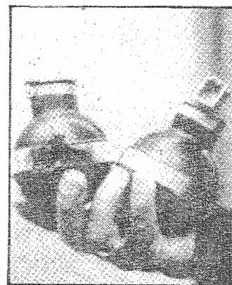
Δύο απ' τις μολότωφ

Γιατί ο, έστω και λίγο, σχετικός αναγνωρίζει με την πρώτη ματιά τις ασφυξιογόνες χειροβομβίδες των ΜΑΤ.