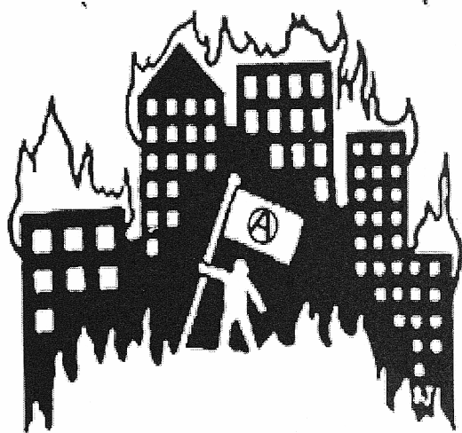
Μία εικόνα που φοβίζει τους καθοδηγητές της κοινής γνώμης και τα αφεντικά τους