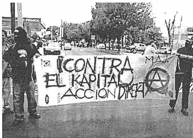
28/5/2004 : ΕΝΑΝΤΙΑ ΣΤΟ ΚΕΦΑΛΑΙΟ, ΑΜΕΣΗ ΔΡΑΣΗ !

Γουαδαλαχάρα, (Jalisco, Μεξικό), 28 του Οκτωβρίου. Περίπου 50 άτομα έκαναν πορεία χτες τη νύχτα, απαιτώντας την απελευθέρωση των 15 διαδηλωτών που βρίσκονται ακόμα φυλακισμένοι και ζήτησαν την τιμωρία αυτών που συμμετείχαν στους βασανισμούς των δεκάδων συλληφθέντων στη διαδήλωση στις 28 του περασμένου Μαΐου ενάντια στη 3η Σύνοδο κορυφής χωρών της Λατινικής Αμερικής και της Καραϊβικής με την Ευρωπαϊκή Ένωση. Πριν την πορεία, προβλήθηκε ένα βίντεο έξω από την πρυτανεία του πανεπιστημίου όπου αποδεικνύει ότι τα επεισόδια ξεκίνησαν από προβοκάτορες της κυβέρνησης που είχαν εισβάλει στην πορεία. (Από το athens.indymedia.org ). (Φωτογραφίες από μεξικάνικα, εναλλακτικά και μη-, ΜΜΕ).