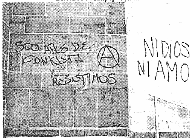
500 ΧΡΟΝΙΑ ΚΑΤΑΚΤΗΣΗ ΚΑΙ... ΑΝΤΙΣΤΕΚΟΜΑΣΤΕ. ΟΥΤΕ ΘΕΟΣ, ΟΥΤΕ ΑΦΕΝΤΗΣ !