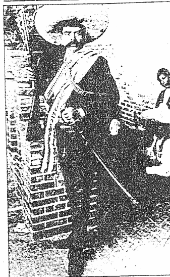
Emiliano Zapata, caudillo legendario de los campesinos mexicanos.

...Έφυγαν οι Καρλιστές κι ήρθαν οι Βιλλύστες... (Η Κατσαριίδα)