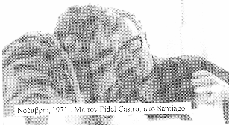
Νοέμβρης 1971 : Με τον Fidel Castro, στο Santiago.