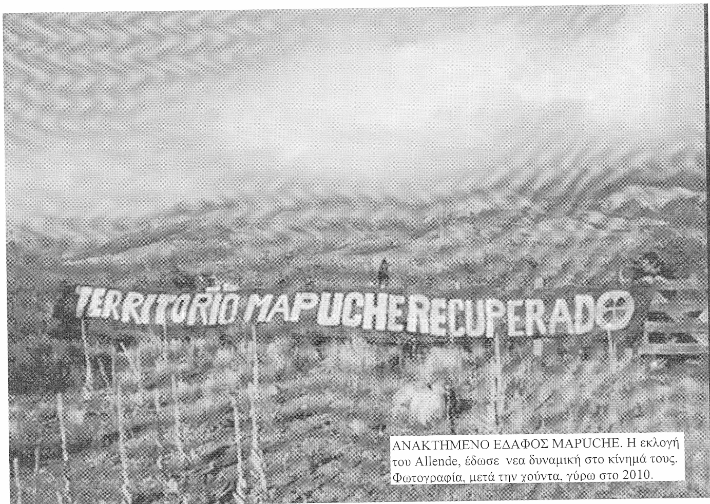
ΑΝΑΚΤΗΜΕΝΟ ΕΔΑΦΟΣ ΜΑΡΟΥΧΕ. Η εκλογή του Allende, έδωσε νέα δυναμική στο κίνημά τους. Φωτογραφία, μετά την γούντα, γύρω στο 2010.

κι ο Salvador υπήρξε ένα από τα ιδρυτικά μέλη της νεολαίας του. Λίγο αργότερα, το 1930, ασχολήθηκε πιο ενεργά με την πολιτική. Εξελέγη επανειλημμένα βουλευτής, πρόεδρος της γερουσίας, διετέλεσε υπουργός υγείας και, το 1970, πρόεδρος της χώρας με τον συνασπισμό της Unidad Popular.