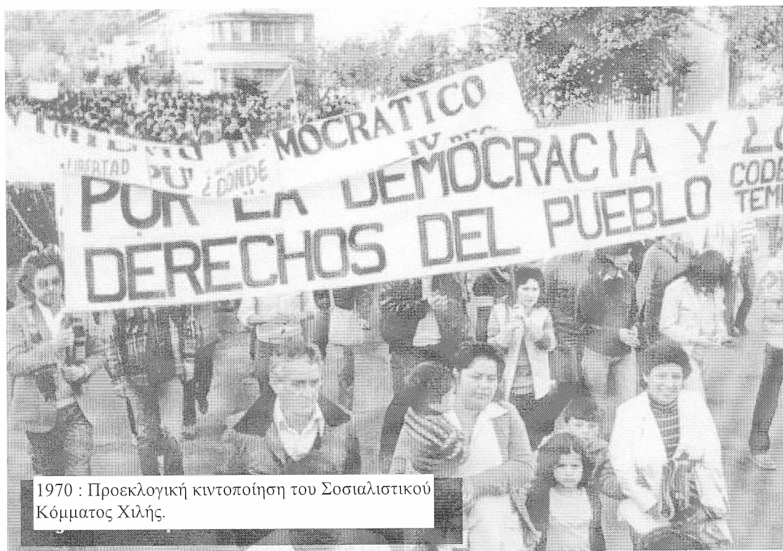
1970 : Προεκλογική κινητοποίηση του Σοσιαλιστικού Κόμματος Χιλής.

Ο Salvador Allende γεννήθηκε το 1906. Ο παππούς του είχε μεταναστεύσει στην Χιλή από την Χώρα των Βάσκων. Ήταν Αναρχικός και, μάλιστα, ίδρυσε στην Χιλή το πρώτο Λαϊκό Σχολείο, για τα παιδιά της επαρχίας όπου ζούσε. Αναρχικός ήταν και ο πατέρας του Salvador. Το πρώτο βιβλίο, που διάβασε ο μετέπειτα πρόεδρος, ήταν του Μπακούνιν και του το είχε δώσει 'ενας