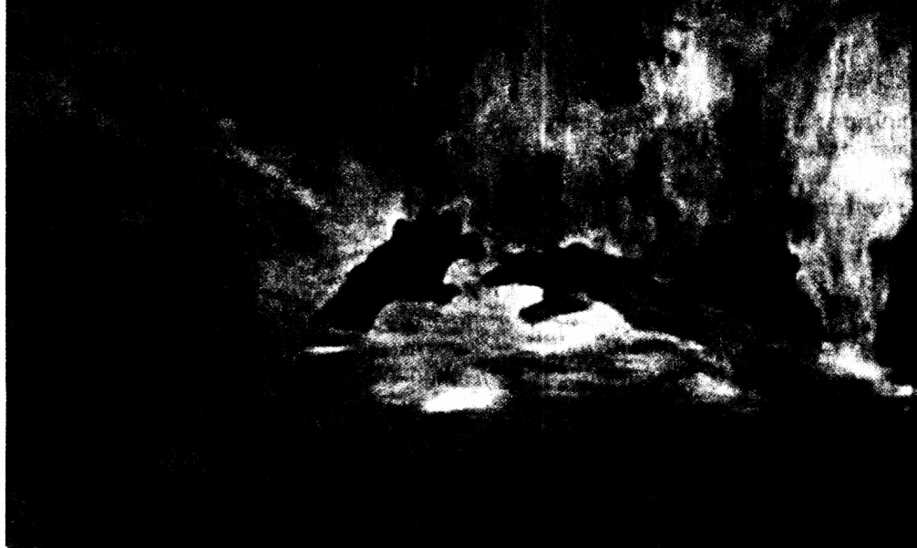
Η απώλεια των εννοικών στις φλόγες του μίσους

ανοί στρα- ις ξένοι πο- χθες συνο- ες σκοτώθη- ινητοπομπή από βόμβα ο πλάι του τανύγια. Εί- ρη επίθεση ερικανών α- ρίου, οπότε α Αμερικα- αιναν σε ε- κατεργίφθη ζα.