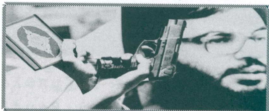
Υποστηρικτές της Χεζμπολάχ κραδαίνουντα: μια φωτογραφία του Νασράλα, ένα πιστόλι και ένα βιβλίο...το οποίο δεν είναι σίγουρα το Κομμουνιστικό Μανιφέστο...

η Χεζμπολάχ, δεν μπορείς να ακούσεις μουσική και ο χορός της κοιλιάς είναι απαγορευμένος. Το «Κόμμα του Θεού» ήταν παλαιότερα κόμμα της αντίστασης και της θυσίας, τώρα είναι ένα κόμμα με αφόρητους κανόνες: οι γυναίκες αναγκάζονται να ντύνονται στο μελαχρινό μαύρο, η πώληση οινοπνεύματος είναι απαγορευμένη, ενώ παρέχεται έμμεση υποστήριξη στη Συρία (με δωροδοκίες, ή και με συριακό έλεγχο όλων σχεδόν των λιβανέζικων θεσμών, κ.λπ...).