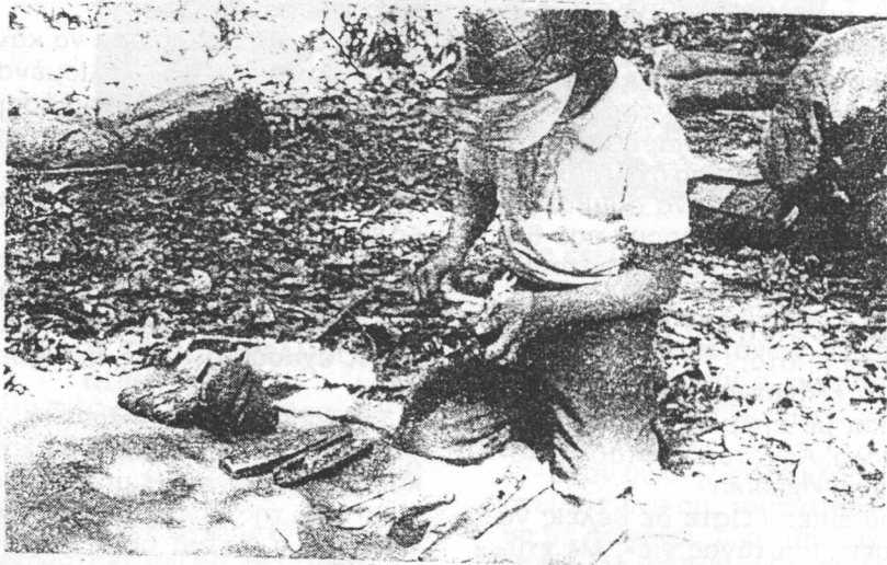
Ποιός ήταν ο «Moncho»;

Το 1969 ο πατήρ Pedro León Rodríguez οργάνωσε το κίνημα της Λαϊκής Ένω- σης που είχε σα στόχο να κινητοποιήσει τους φτωχούς και χωρίς κανένα έσοδο ανθρώπους του Corinto (της περιοχής της Κάουκα)· αυτό το κίνημα επιδίωκε ν' αντιμετωπίσει τα προβλήματα κατοικίας, γης, υγείας και εκπαίδευσης, αλλά ε- πίσης ν' αγωνιστεί ενάντια στους πολυάριθμους πολιτικούς που διαίρουσαν το χωριό.