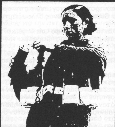
Αυτόνομη γυναικεία εκδοτική ομάδα

Μετά την καταστολή και με δεδομένη την ε- νεργοποίηση ενός κόσμου εκτός καταλήψεων. οι καταλήψεις δρομολογούν μια σειρά συν- τησεων στα κατελημμένα σπίτια και καλούν σε δημόσια συζήτηση στο Πολυτεχνείο για την εκτίμηση της συγκυρίας όπως διαμορφώθηκε μετά το χτύπημα της Ασκληπιού και για την οργάνωση της παραπέρα προώθησης των κα- ταλήψεων. Η διαδικασία συνεχίστηκε με συζη- τήσεις στα κατελημμένα σπίτια, πάντα με τη συμμετοχή ενός κόσμου ενδιαφερόμενου για το στεγαστικό και τις καταλήψεις. Σημαντικό μέρος των καταλήψεων καθώς και άλλες ομά- δες και άτομα αναγνωρίζουν την αναγκαιότη- τα, αλλά και τη δυνατότητα μιας συγκέντρωσης τους στην προοπτική και των δραστηριοτήτων.