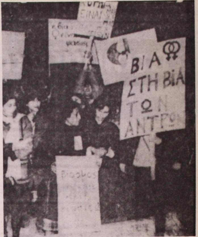
Πορεία διαμαρτυρίας γυναικών στην Αθήνα 3 Δεκεμβρίου 1981

«Όχι άλλοι βιασμοί Αντίσταση στη Βία τη καθημερινή»