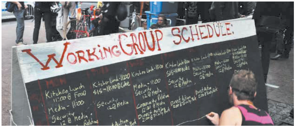
ΑΤΡΟΜΗΤΟΙ: Ένας εθελοντής αναγράφει το πρόγραμμα ανοιχτών συναντήσεων των Ομάδων Εργασίας στη Λίμπερτι Σκουέρ.