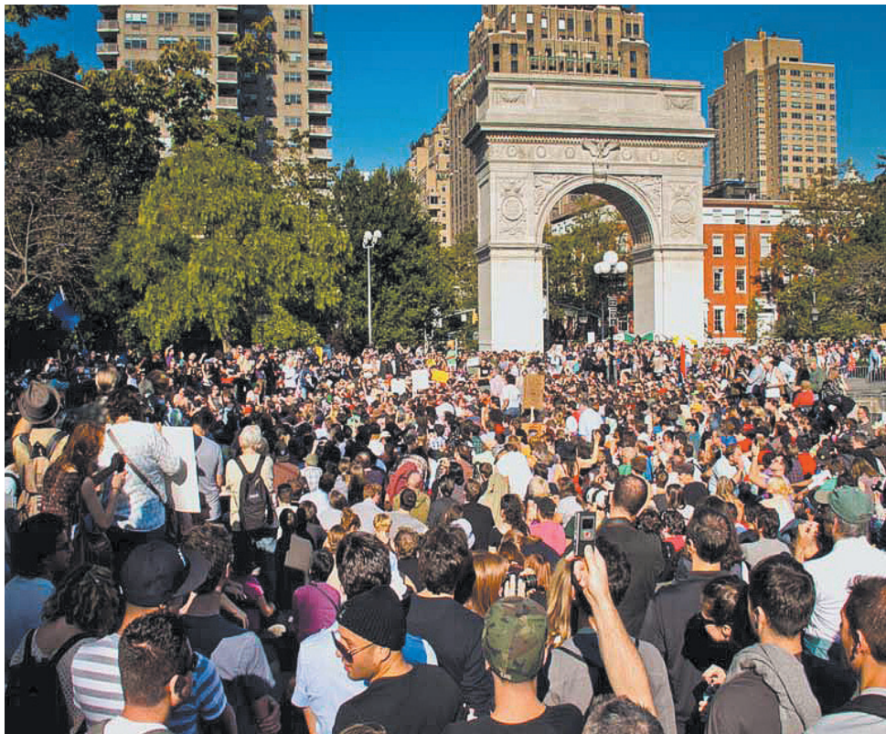
ΜΕ ΜΕΓΑΛΗ συμμετοχή φοιτητών και μαθητών, καταλήψεις από όλη την πόλη διαδήλωσαν πολλές φορές στην Ουάσιγκτον Σκουέρ, όπου πραγματοποιήθηκαν τουλάχιστον δύο γενικές συνελεύσεις.