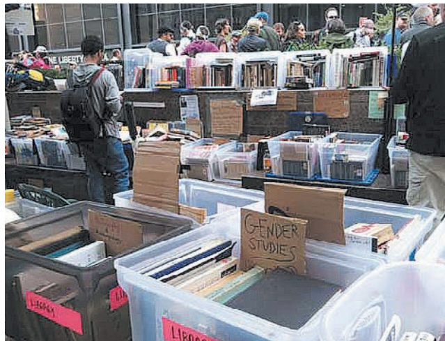
ΟΙ ΒΙΒΛΙΟΘΗΚΕΣ, ΟΠΩΣ ΚΑΙ ΟΙ ΕΦΗΜΕΡΙΔΕΣ, είναι πυλώνες μιας δημοκρατικής κοινωνίας

«Και να 'μαι!», είπε εύθυμα, ενώ αρχειοθετούσε βιβλία σε διάφανα πλαστικά μποξ, που αραδιάζονταν κατά ντουζίνες στο βορειοανατολι-