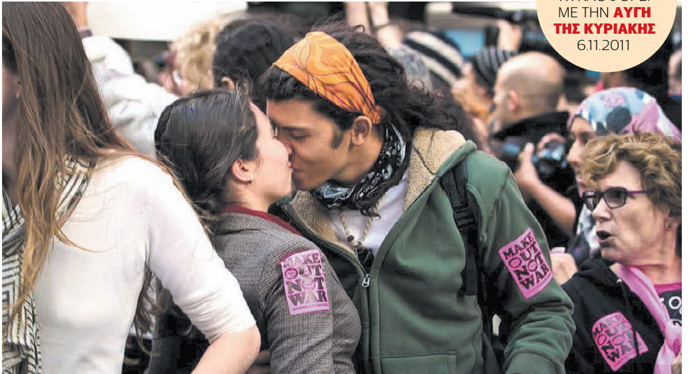
ΚΑΤΑΛΗΨΗ ΤΗΣ ΤΑΙΜΣ ΣΚΟΥΕΡ: Τη διεθνή μέρα δράσης, στις 15 Οκτωβρίου, κινητοποιήθηκαν οι πολίτες δεκάδων πόλεων σε όλο τον κόσμο.

«Και να 'μαι!», είπε εύθυμα, ενώ αρχειοθετούσε βιβλία σε διάφανα πλαστικά μποξ, που αραδιάζονταν κατά ντουζίνες στο βορειοανατολι-