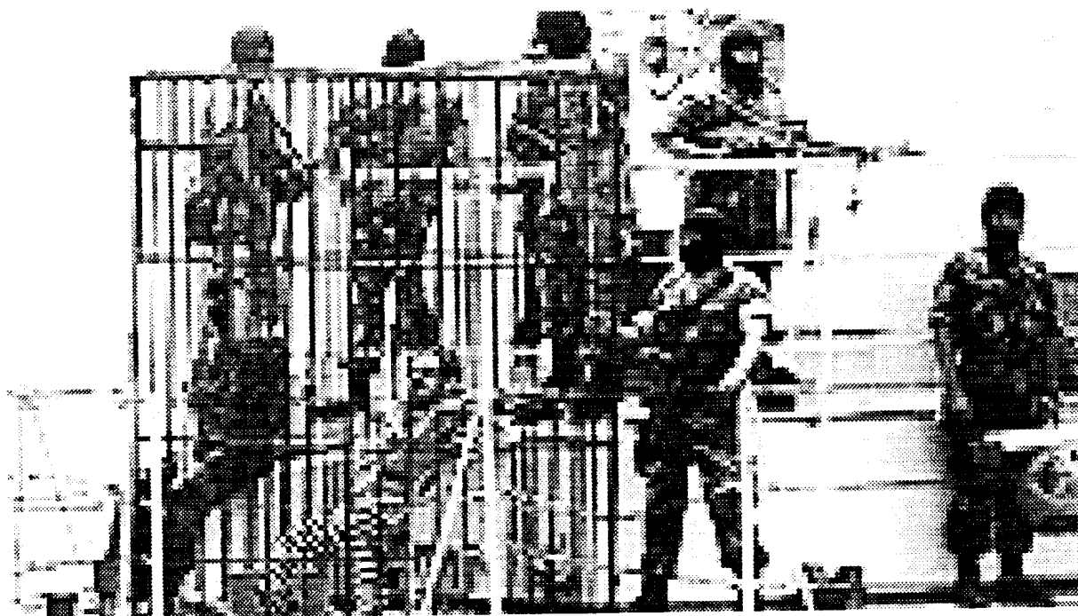
Μια απ' τις σπάνιες φωτογραφίες του Guzman στις φυλακές του Callao, κατά τη διάρκεια μιας απ' τις ελάχιστες «εξόδους» του από την υπόγεια απομόνωση.