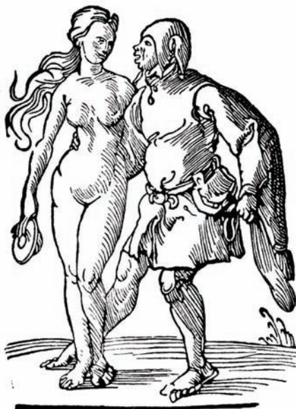
‘Η αλήθεια, ξυλογραφία άνωγύμου, 16. αιώνας.

Ε, παλιατζή, έχεις να μου δώσεις καμιά ξεχασμένη αλήθεια, την αγοράζω, πόσο θες;