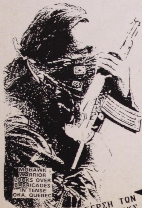
Η ΕΞΕΓΕΡΣΗ ΤΩΝ ΙΝΔΙΑΝΩΝ ΜΟΧΟΚΣ ΣΤΟΝ ΚΑΝΑΔΑ 11 ΙΟΥΛΙΟΥ-28 ΣΕΠΤΕΜΒΡΙΟΥ 1990