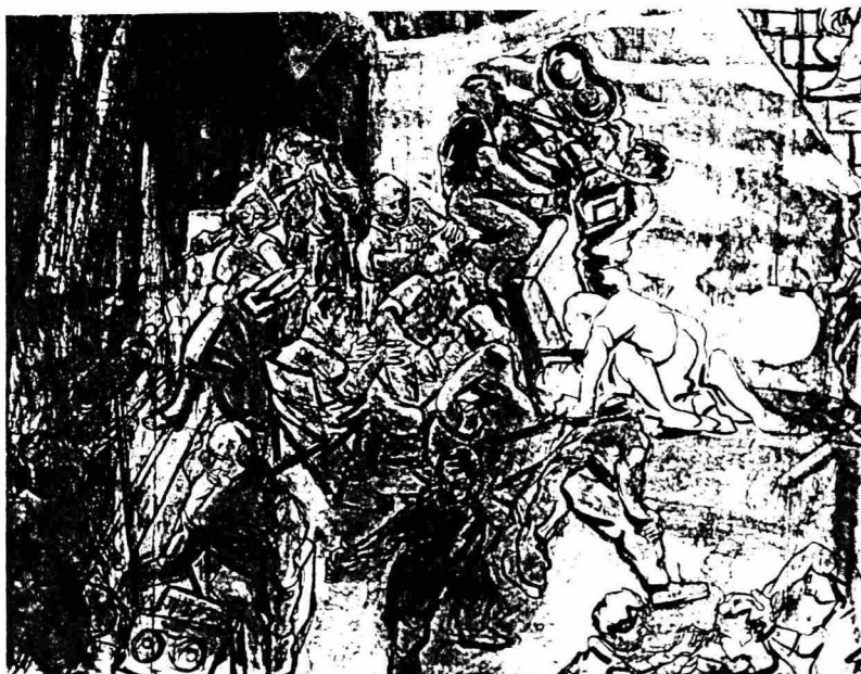
Rehearsal for a Cinematic Rape I, 1995: Pencil/Ink/Pastel on Paper, by John Dewe Mathews