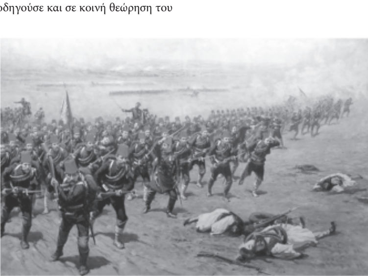
Η μάχη τουΔομοκού (πίνακαςτου Fausto Jonnaro)

Ας ξεκινήσουμε όμως από την πρώτη τέτοια απόπειρα.