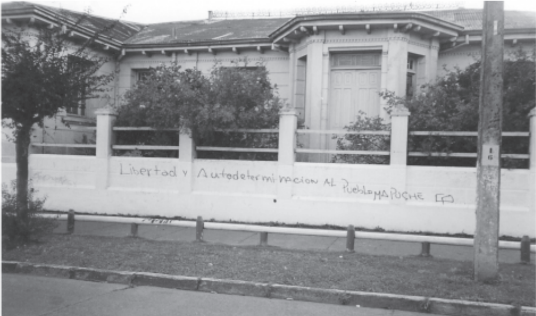
Valdivia, Araucania (Γη των Μαπούτσε), Χιλή 2002, «Ελευθερία και Αυτοκαθορισμός στο λαό των Μαπούτσε»

Την ώρα που η παγκόσμια καπιταλιστική ελίτ και τα τσιράκια τους επεξεργάζονταν τα σχέδια ανανέωσης της εκμετάλλευσης δισεκατομμυρίων ανθρώπων, εκατοντάδες διαδηλωτές γεμάτοι οργή και αποφασιστικότητα κατέβαιναν στους δρόμους της πόλης. Στις 6 Οκτώβρη το πρωί, περίπου 3.000 άνθρωποι συγκεντρώθηκαν στην περιοχή Beyoglu για να κάνουν πορεία μέχρι την κεντρική πλατεία Taksim, προσπαθώντας να πλησιάσουν στο σημείο που γινόταν η σύνοδος. Λίγο αργότερα, και ενώ οι διαδηλωτές βρίσκονταν περίπου 100 μέτρα από το χώρο της συνόδου, τα τουρκικά ΜΑΤ επιτέθηκαν στους συγκεντρωμένους με πλαστικές σφαίρες, χημικά και κανόνια νερού. Από εκείνη τη στιγμή