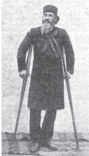
Ο Amilcare Cipriani τραυματίας μετά τη μάχη του Δομοκού

Ο Βίκτωρ Ουγκώ έγραψε στο ημερολόγιό του για τη θλιψη του απέναντι στο θάνατο του «κόκκινου ιππότη», ενώ νεκρολογία γι’ αυτόν