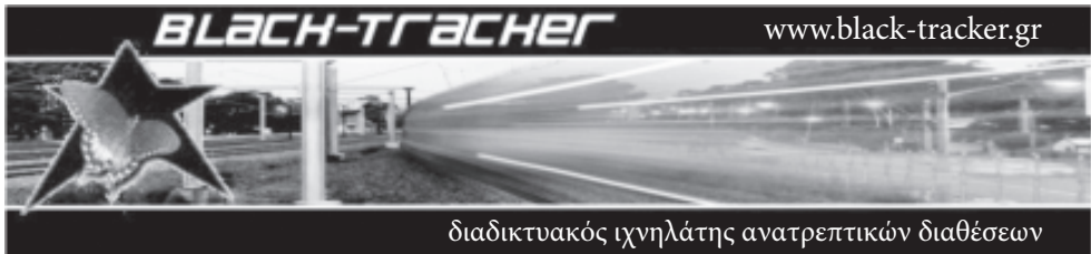
διαδικτυακός ιχνηλάτης ανατρεπτικών διαθέσεων