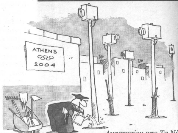
Αναστασίου από Τα Νέα

Η μονιμοποίηση της επιτήρησης με την τοποθέτηση της κάμερας στους δρόμους, στις συγκοινωνίες, στις πλατείες κ.λ.π. αποτελεί καταλυτικό μέτρο για τη θεσμοποίηση της σωφρονιστικής κοινωνίας. Επειδή η σωφρονιστική κοινωνία δεν είναι αυτή που ονειρευόμαστε, ας μη φανούμε ούτε ανεκτικοί, ούτε αδιάφοροι απέναντι σ' αυτές τις ύπουλες εγκαταστάσεις και ας προτάξουμε ένα κοινωνικό όραμα με λιγότερες κλειδαριές και συναγερμούς. Μιλώντας για κοινωνικό όραμα δεν εννοούμε μια ιδεολογική πλατφόρμα έτοιμων λύσεων και σαφώς καθορισμένων βημάτων. Δεν είναι τα προγράμματα, οι θεωρίες και οι συνταγές της προόδου που μας λείπουν, αλλά η φαντασία, η θέληση και η τόλμη να αρχίσουμε να επεμβαίνουμε θετικά στην αποξενωτική καθημερινότητα. Να συνάψουμε άλλου τύπου επικοινωνίες, να δώσουμε ζωή στις γειτονιές μας, να κερδίσουμε την αυτονομία μας και να αρνηθούμε την παντοδυναμία και κάθε ψυχρό εποπτικό μέσο της ηγεσίας. Όξω οι κάμερες από τις γειτονιές μας.