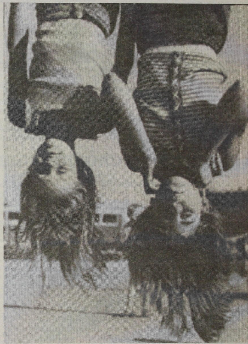
Αγαπητοί φίλοι και σύντροφοι,

Στο 47ο φύλλο της εφημερίδας σας (23 Μαρτίου 1996) αναφερθήκατε στη γελοιότητα της "κοινωνικής και εθνικής χειραφέτησης" του νέου περιοδικού "άρδην", χωρίς παραπέρα σχόλια. Πρέπει όμως αμέσως να σχολιαστούν και να μην περάσουν απαρατήρητες δύο σημαντικές πλευρές αυτής της υπόθεσης.