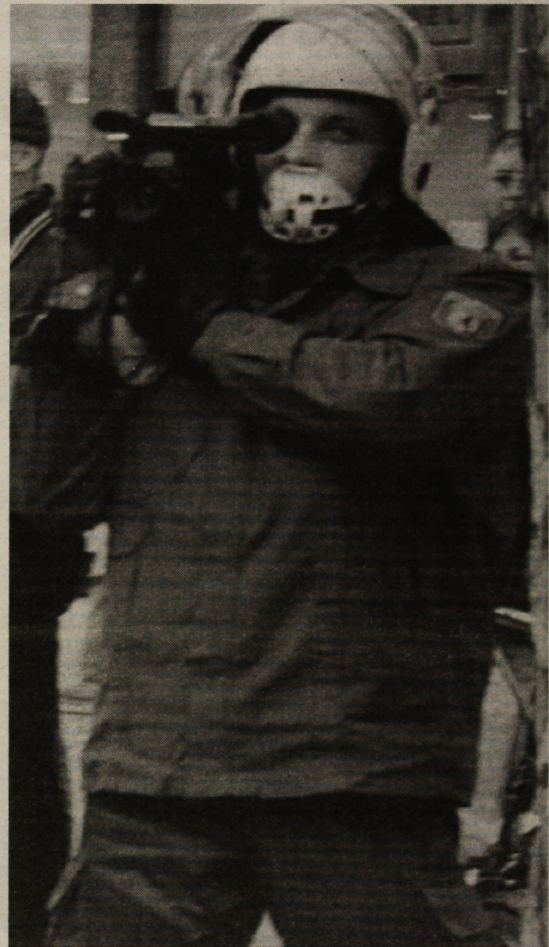
Μια φωτογραφία με πολλές προεκτάσεις, μια φωτογραφία που αν δεν είχε ταρβηχτεί στο Βερολίνο, θα μπορούσε να προέρχεται από το περσινό πολυτεχνείο...

Τα κίνητρα για αυτή τη δράση των ΜΜΕ είναι πολλά. Από τη μια, είναι σαφές ότι διεκπεραιώνουν ένα συγκεκριμένο σχέδιο καταστολής. Παράλληλα όμως, υπάρχει και ο μεταξύ τους ανταγωνισμός στη μάχη της ακροαματικότητας, δηλαδή το άμεσο οικονομικό συμφέρον. Υπάρχει επίσης το στοιχείο της εκδικητικότητας (ως αποτέλεσμα των διάφορων "συναντήσεων" τους με τη μητροπολιτική νεολαία), αλλά και το στοιχείο της ζήλειας και του φθόνου. Οι αισχροί και συνάμα αξιοθρήνητοι πρωταγωνιστές τους βρίσκονται αντιμέτωποι με κάτι που είτε δεν το έζησαν ποτέ και το φοβούνται (όπως στην περίπτωση γνωστού τηλεπαρουσιαστή που αναρωτιόταν "μα πώς γίνεται να χορεύουν μέσα στα δακρυγόνα; Θα πρέπει να έχουν πά-