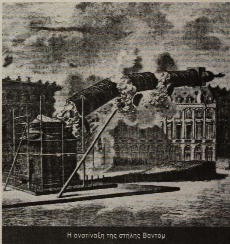
Η ανατίναξη της στήλης Βαντόμ

Προσχέδιο της επιστολής-αποποίησης του παρασήμου της Λεγεώνας της Τιμής που απονεμήθηκε στο ζωγράφο λίγο πριν την Παρισινή Κομμούνα