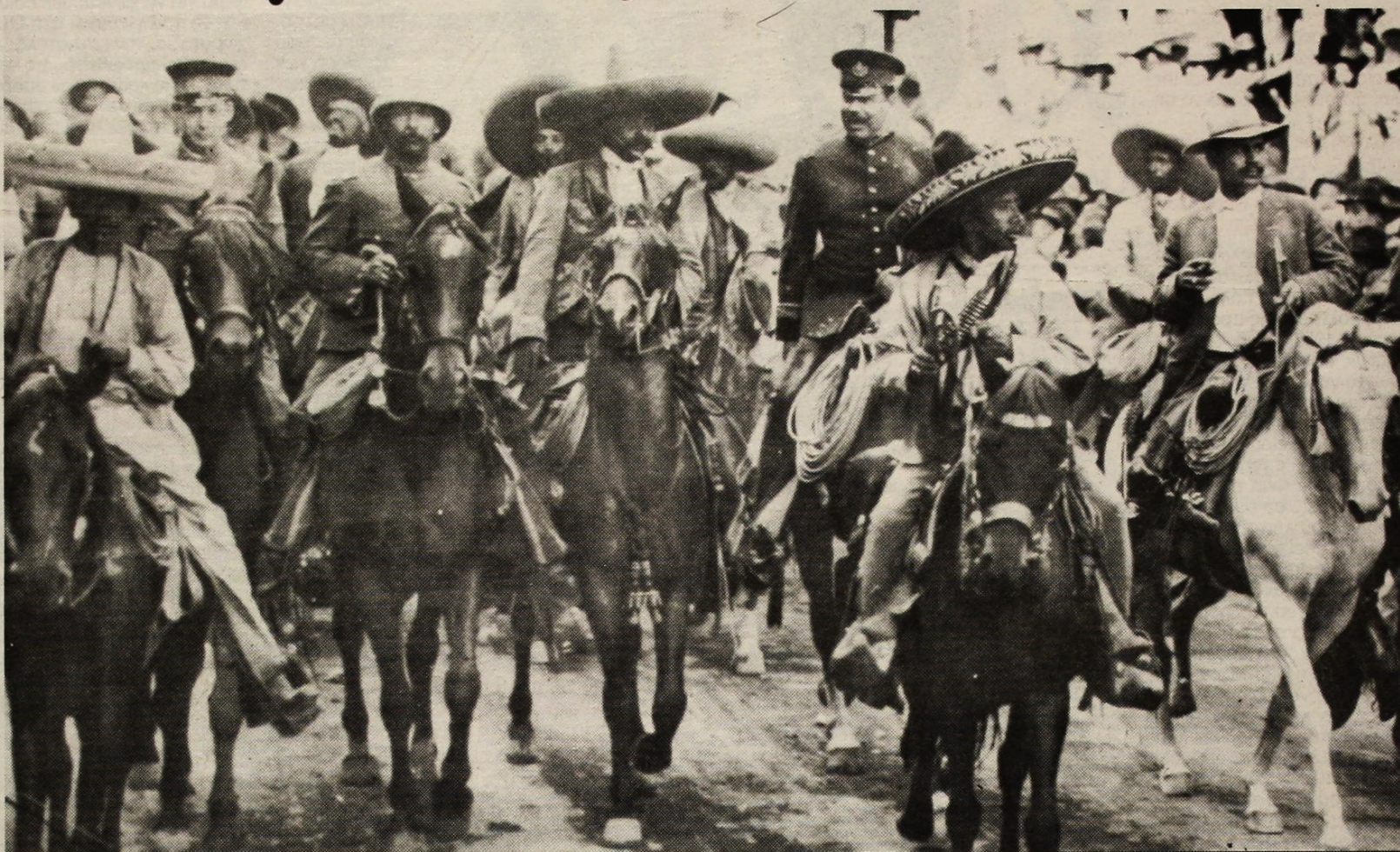
10 Δεκέμβρη 1914. Οι μαχητές του Εμιλιάνο Ζαπάτα και του Φρανθίσκο Βίγια καταλαμβάνουν την πρωτεύουσα του Μεξικό