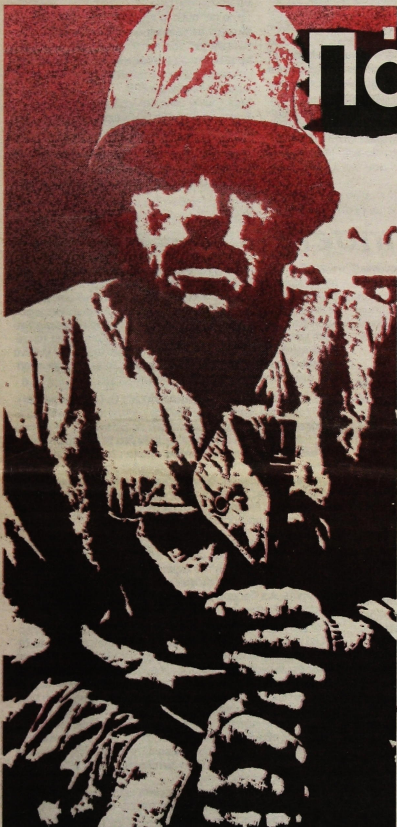
Οι τοπικοί πόλεμοι δεν σταματούν. Απλά εξαφανίζονται ή επανεμφανίζονται στις οθόνες των τηλεοράσεων.