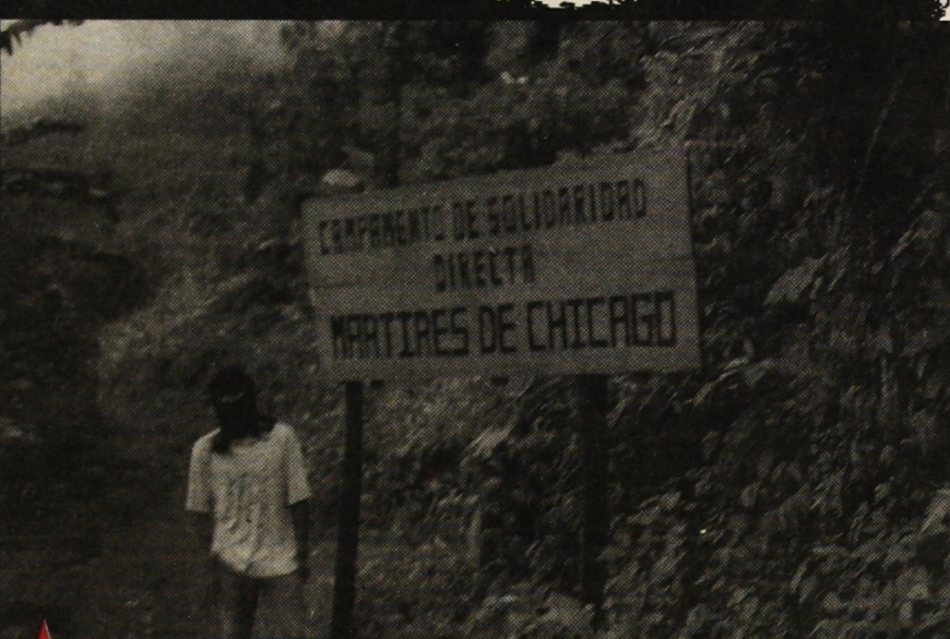
Η είσοδος του καταυλισμού.

Για περισσότερες πληροφορίες, απευθυνθείτε στην Πρωτοβουλία Αλληλεγγύης στον Αγώνα των Ζαπατίστας, Τ.Θ. 50042, Τ.Κ. 54013, Θεσσαλονίκη