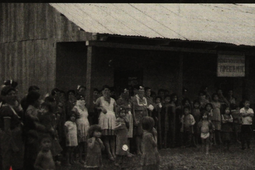
Γυναίκες και παιδιά από την κοινότητα, μπροστά στο σχολείο.