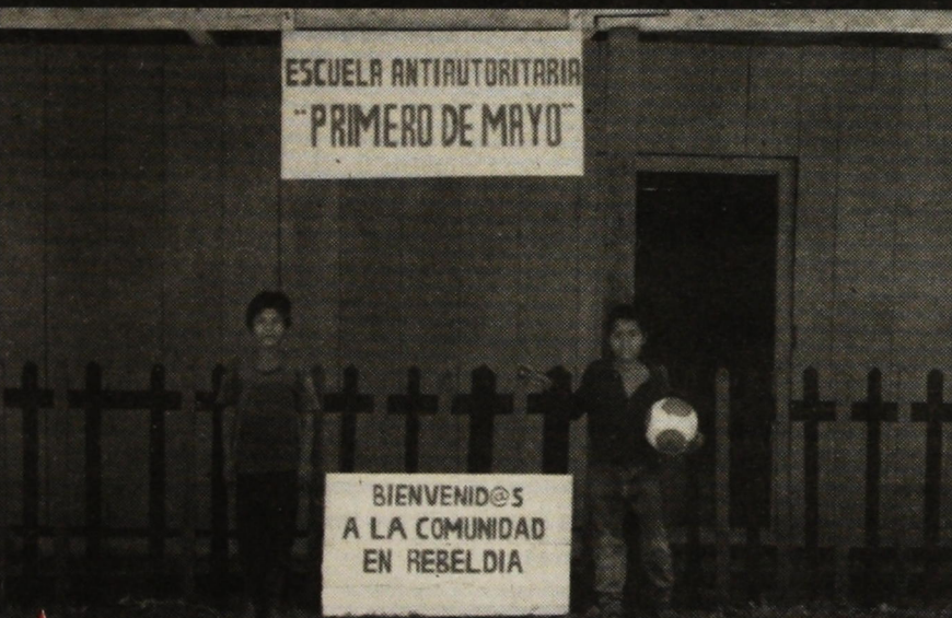
Η είσοδος του αντιεξουσιαστικού σχολείου “Πρώτη Μάη”. “Καλωσήρθατε στην εξεγερμένη κοινότητα”.