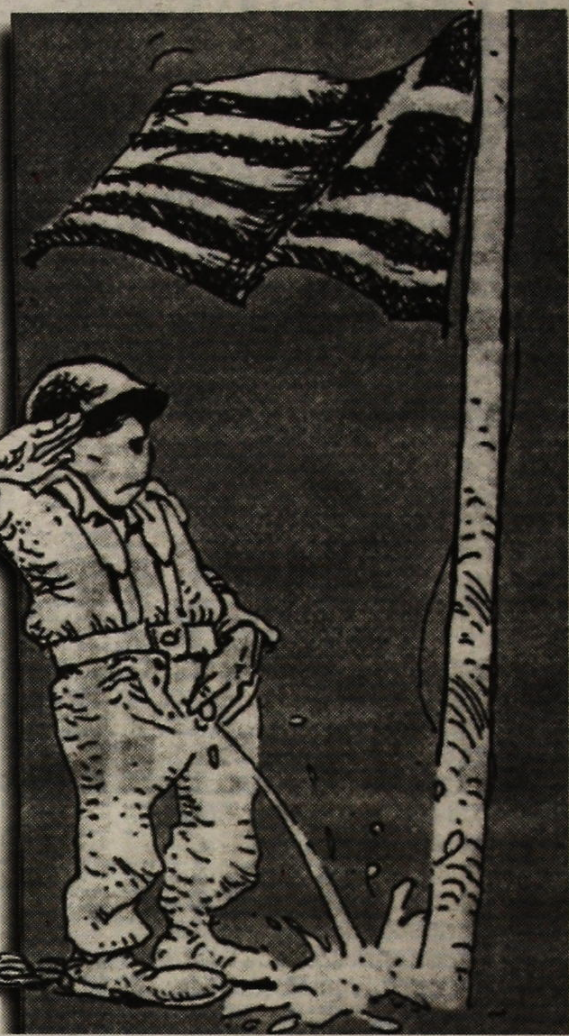
Ένας επερχόμενος ολικός αρνητής στρατεύσεως

σους παίρνουν τρελόχαρτο. Μια διευκρίνιση: υπάρχουν αυτοί που πήραν, μ' αυτόν τον τρόπο, απαλλαγή με αξιοπρέπεια και άλλοι που την άφησαν έξω από την πύλη του στρατοπέδου. Τους πρώτους τους σέβομαι απόλυτα, τους δεύτερους δεν μπορώ να τους καταλάβω.