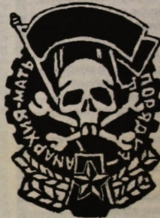
"Αναρχία-μητέρα της τάξης"

ρα σκληρές στη Λευκορωσία, όπου το καθεστώς του δικτάτορα Λουκασένκο καταπνίγει κάθε αντίθετη άποψη. Σχετικά με την κατάσταση στη Λευκορωσία αλλά και την υπόθεση του Vacla Jez, θα υπάρξει ειδική ενημέρωση σε επόμενο φύλλο του "Αλφα".