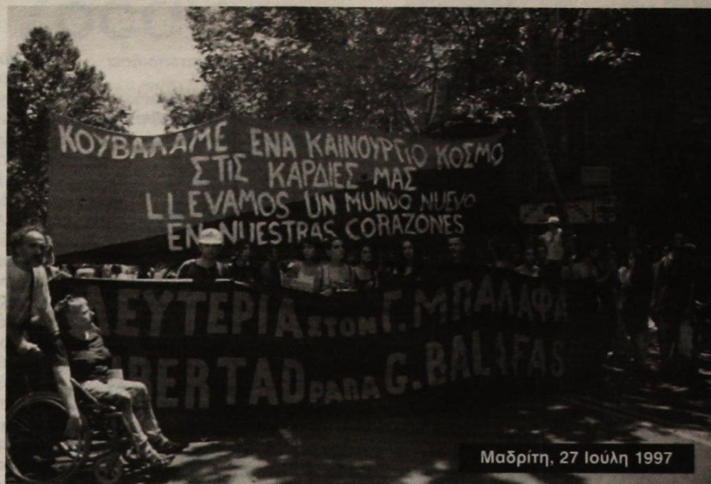
Μαδρίτη, 27 Ιουλίου 1997

28, 29, 30 και 31 Ιουλίου. Συζητήσεις στις διάφορες ομάδες εργασίας. Όσοι έμειναν στην Μαδρίτη, συζητούν στους χώρους μιας τεράστιας